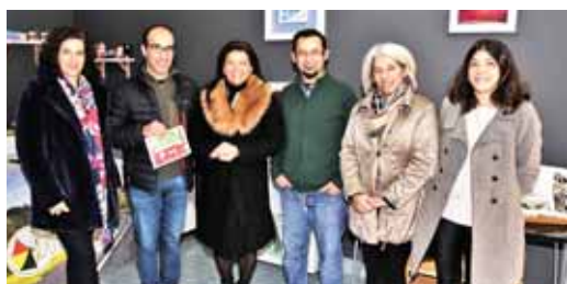
➤ PASSATEMPO DE NATAL