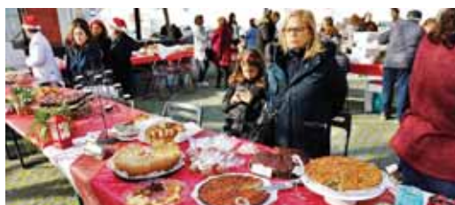
➤ NATAL À MESA