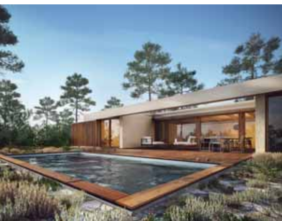
➤ PESTANA TROIA