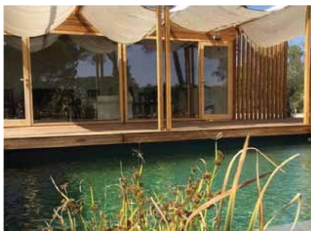
➤ BREJO DA AMADA