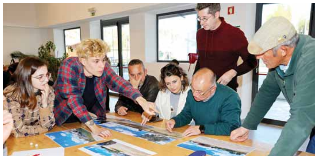
☉ 16.ª SESSÃO PÚBLICA DE TRABALHO UM MONUMENTO PARA O LOUSAL – APRESENTAÇÃO DA PROPOSTA FINAL

A população da Aldeia Mineira do Lousal escolheu o projeto escultórico e o local onde será implantado o Monumento resultante do trabalho desenvolvido no âmbito do projeto participativo de Arte Pública “Um Monumento para o Lousal”, centrado no objetivo de criar arte com a comunidade.