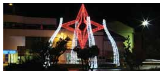
➤ ILUMINAÇÕES DE NATAL