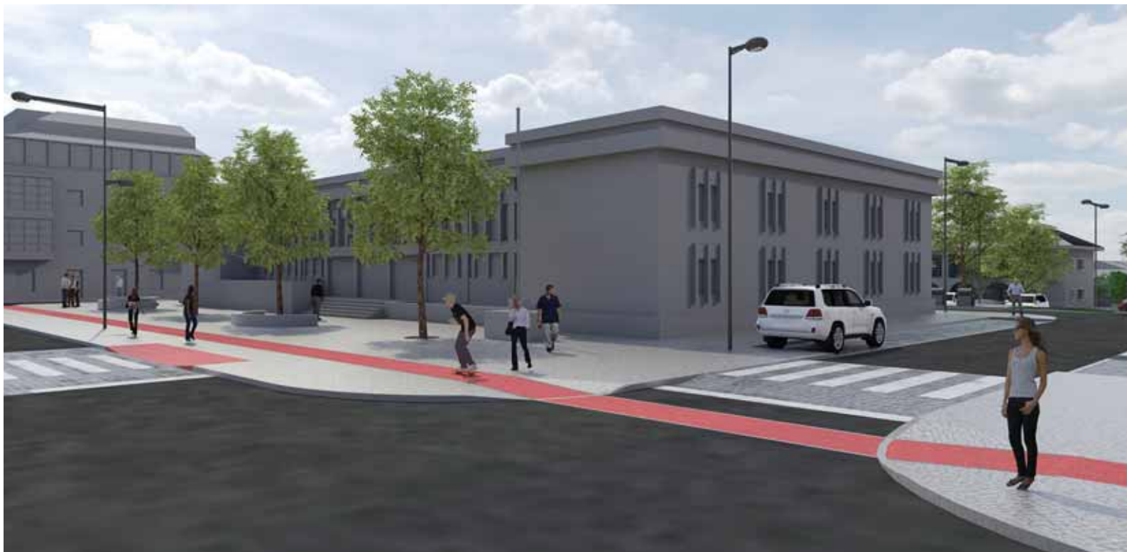
↳ LARGO DO TRIBUNAL

O projeto de requalificação da Avenida Jorge de Vasconcelos Nunes, desenvolvido pela equipa de projeto da Câmara Municipal e integrando contributos que foram recolhidos nas sessões de apresentação realizadas com a população e com os eleitos municipais, está concluído e vai avançar para concurso público.