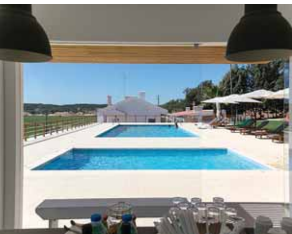
➤ CASAS DO RIO SADO