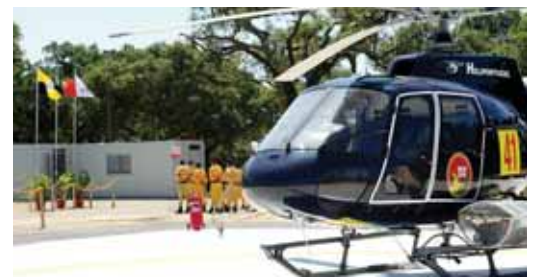
CENTRO DE MEIOS AÉREOS DE GRÂNDOLA