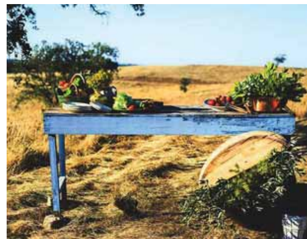
➤ TERRA DO SEMPRE