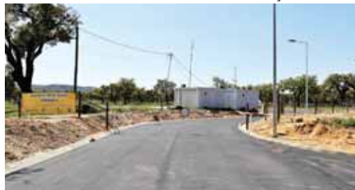
CENTRO DE MEIOS AÉREOS – ZONA DE ACESSO