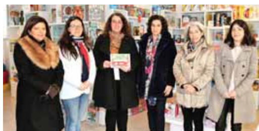
➤ PASSATEMPO DE NATAL