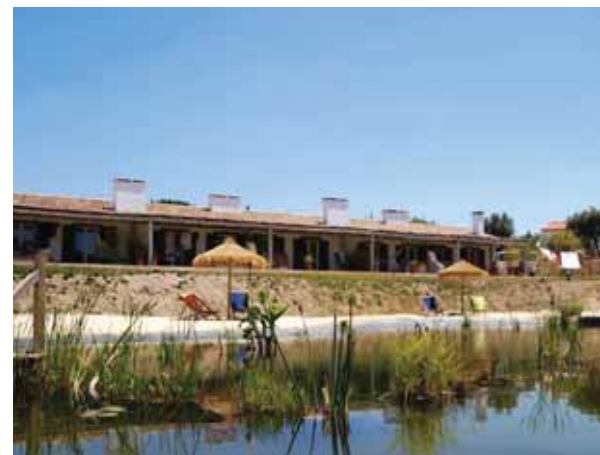
➤ NÔMADE AUBERGE RURALE