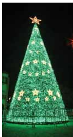
➤ ILUMINAÇÕES DE NATAL