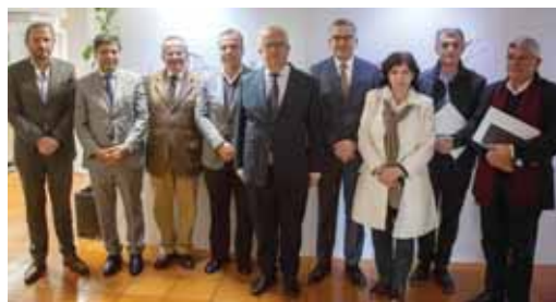
REUNIÃO COM O MINISTRO DA ADMINISTRAÇÃO INTERNA