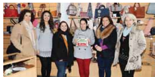
➤ PASSATEMPO DE NATAL