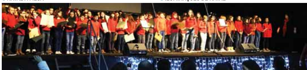
➤ CONCERTO DE REIS