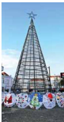
➤ TRABALHOS FEITOS PELOS ALUNOS