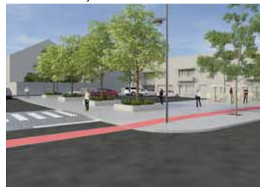
↳ CRUZAMENTO COM A RUA 1º DE MAIO