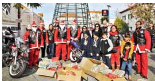
➤ MOTOCUBE DE GRÂNDOLA

Entre concertos de natal, dezenas de atividades desenvolvidas no âmbito do programa "Vivam as Férias" houve ainda espaço para Concertos de Reis, e foram conhecidos os vencedores do tradicional sorteio de natal que ao longo dos anos tem incentivado os grandolenses a realizar as compras de natal no comércio local. Veja aqui os momentos mais felizes e animados desta quadra: