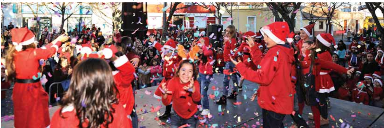
➤ AQUI HÁ NATAL – DESFILE E CHEGADA DO PAI NATAL