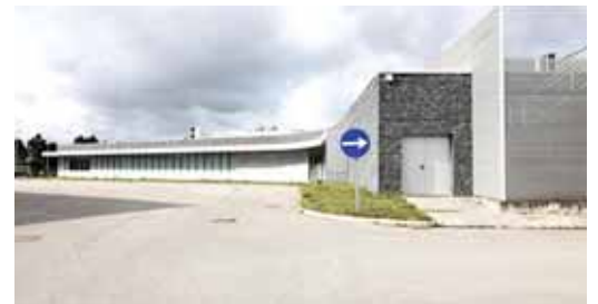
INFRAESTRUTURAS DE PORTUGAL – EDIFÍCIO

de um posto avançado dos Bombeiros Mistos de Grândola, no Carvalhal – capaz de dar resposta a toda a zona litoral do Concelho. Por fim, aproveitando a presença do Secretário de Estado da Proteção Civil, José Artur Neves, o Presidente da