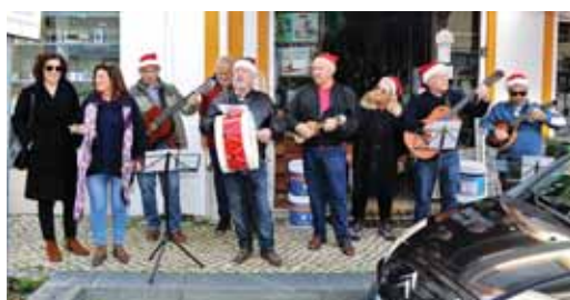
➤ CANTANDO O NATAL