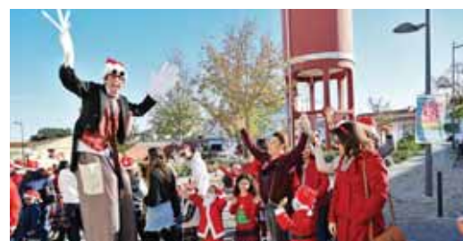
➤ AQUI HÁ NATAL – DESFILE E CHEGADA DO PAI NATAL