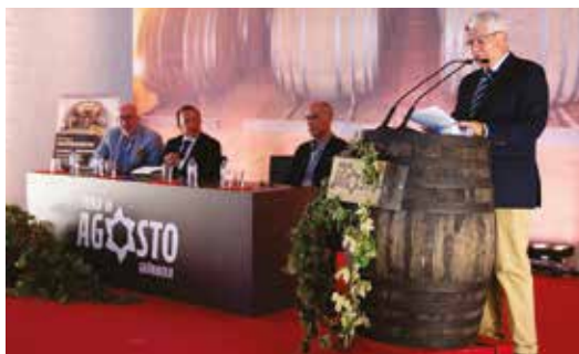
SESSAO DE ABERTURA DA FEIRA DE AGOSTO