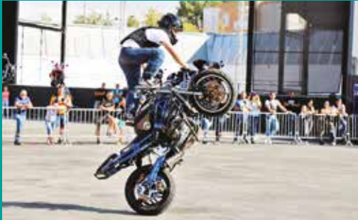
1.ª Concentração Motard – Moto Clube de Grândola