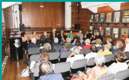
Encontro da Canção de Protesto – Encontro-colóquio do Conselho Consultivo do OCP