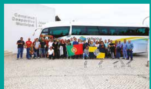
Grândola apoia a Seleção Nacional