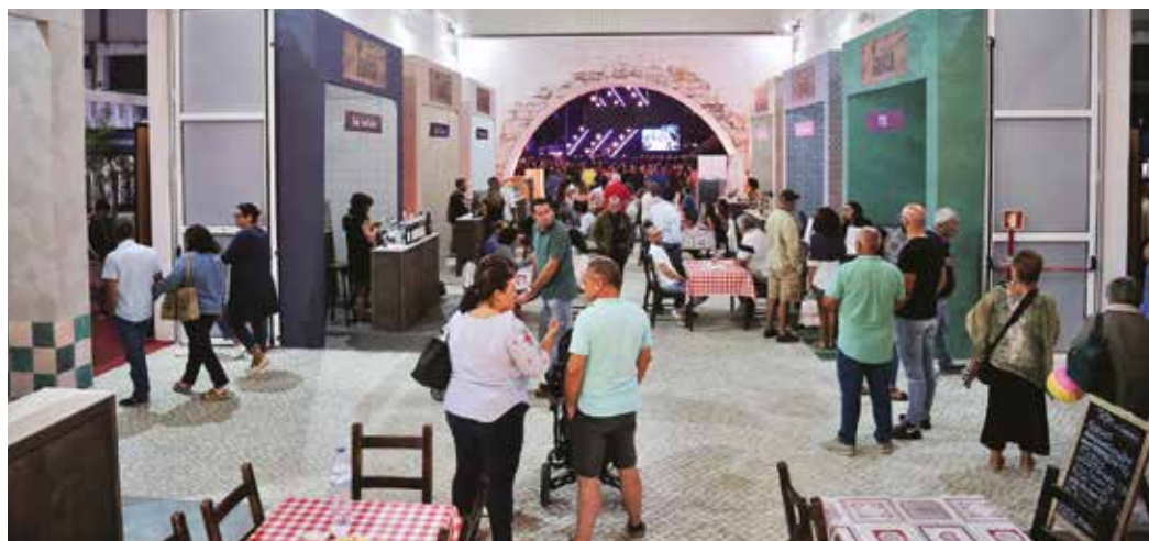
➤ A NAVE CENTRAL DEU LUGAR A UMA TRADICIONAL ADEGA ONDE OS VISITANTES TIVERAM A OPORTUNIDADE DE SABOREAR ALGUNS DOS PRODUTOS MAIS CARACTERÍSTICOS DA REGIÃO ACOMPANHADOS POR VINHOS DE PRODUTORES REGIONAIS

Na edição de 2019 destaque para os produtos endógenos: arroz e azeite são considerados produtos locais reconhecidamente importantes no desenvolvimento económico do nosso território e foram o tema da exposição que esteve patente ao longo do certame.