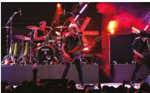
XUTOS E PONTAPÉS