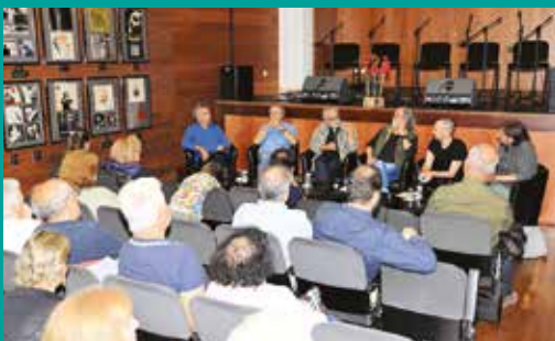
Encontro da Canção de Protesto – Sessões testemunhais dedicadas ao universo da canção de protesto