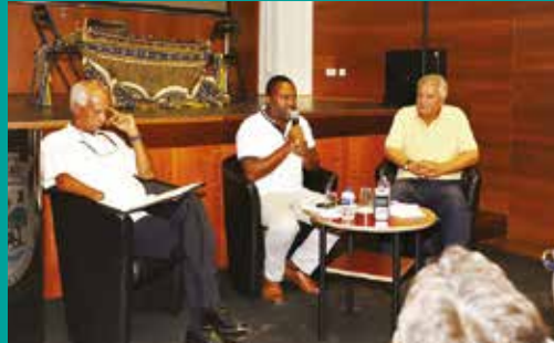
Apresentação do livro “A Escrava Domingas” de António Chainho