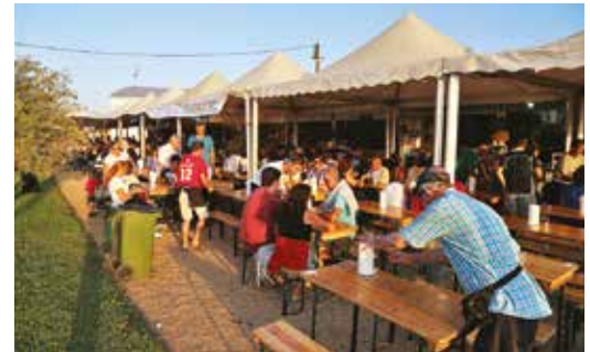
TASQUINHAS PRODUTOS REGIONAIS