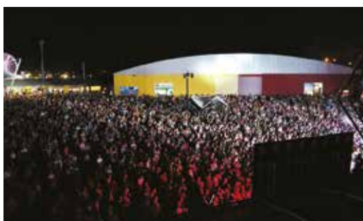
PRAÇA DA FEIRA DE AGOSTO