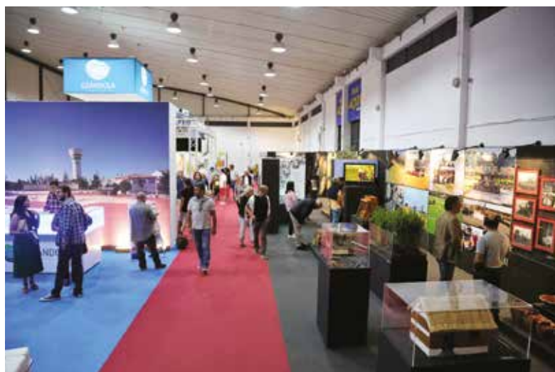
➤ A VALORIZAÇÃO DOS PRODUTOS LOCAIS TEM SIDO UMA APOSTA DO EXECUTIVO MUNICIPAL