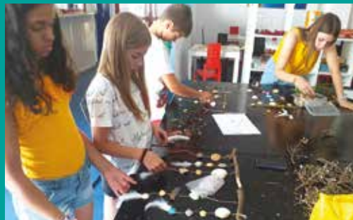
Vivam as Férias – Verão 2019