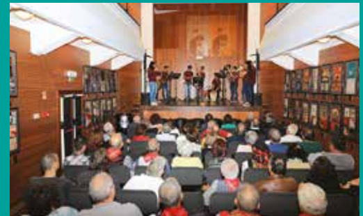
Encontro da Canção de Protesto – Canções de resistência portuguesas pelo Ensemble da SMFOG