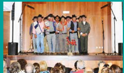
Encontro da Canção de Protesto – Grupo Coral Vila Morena