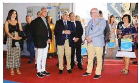
VISITA AOS EXPOSITORES