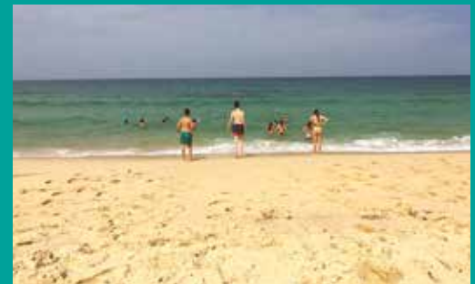
Vivam as Férias – Verão 2019