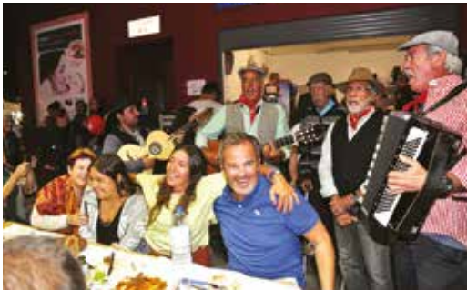
ANIMAÇÃO DE RUA