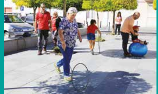
Comemorações do Dia Mundial do Coração