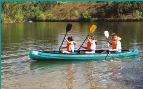
Vivam as Férias – Verão 2019