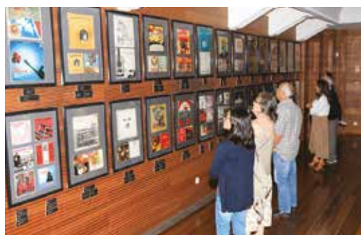
EXPOSIÇÃO DE CAPAS DE DISCOS DE VINIL - PRODUÇÃO DISCOGRÁFICA EDITADA EM PORTUGAL ENTRE 1960 E 1978