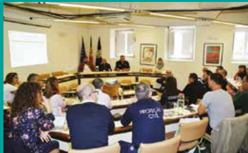
Reunião Distrital dos Serviços Municipais de Proteção Civil