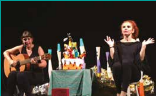
É uma vez... Som do Algodão