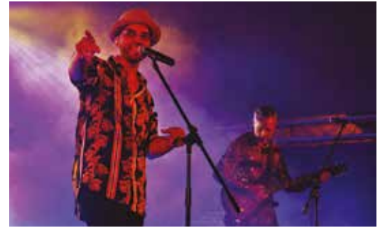
DADDY JACK BAND