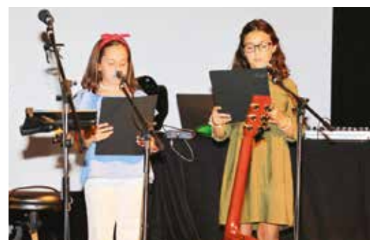
MOMENTO DE POESIA - É URGENTE CONSTRUIR CERTAS PALAVRAS PELOS ALUNOS DO AGRUPAMENTO DE ESCOLAS DE GRÂNDOLA E DA ESCOLA PROFISSIONAL DE DESENVOLVIMENTO RURAL DE GRÂNDOLA

O sucesso originado pela Exposição Coletiva de Escultura, patente em maio de 2018 na vila morena, levou a Câmara Municipal a organizar o Simpósio de Escultura em Pedra, que decorreu entre os dias 16 e 30 de setembro, com a participação de três reconhecidos escultores portugueses: Jorge Pé-Curto, Paulo Neves e Vitor Ribeiro. Os artistas criaram três esculturas de pedra a instalar em Grândola, no Carvalhal e em Melides que pretendem contribuir para a valorização dos espaços públicos do ponto de vista artístico, estético, identitário e patrimonial. No âmbito do simpósio Jorge Pé-Curto realizou uma obra em homenagem a Fernando Pessoa e aos seus heterónimos, que será colocada num local nobre da vila de Grândola. Paulo Neves teve como referência a maior extensão de linha de praias do país, com condições ambientais e paisagísticas de elevado interesse, concebendo uma peça sobre o mar e o sol colocada na 1ª rotunda à entrada do Carvalhal, de acesso à localidade e à Alameda das Praias. Finalmente, Vitor Ribeiro entendeu prestar um tributo à tradição oleira de Melides, produzindo uma obra que irá ser colocada no espaço requalificado do núcleo museológico da Olaria de Melides. O simpósio decorreu em espaço aberto, no exterior do Complexo Desportivo Municipal José Afonso, e teve como objetivo contribuir para o despertar do interesse da comunidade pela arte, e estimular os mais jovens para