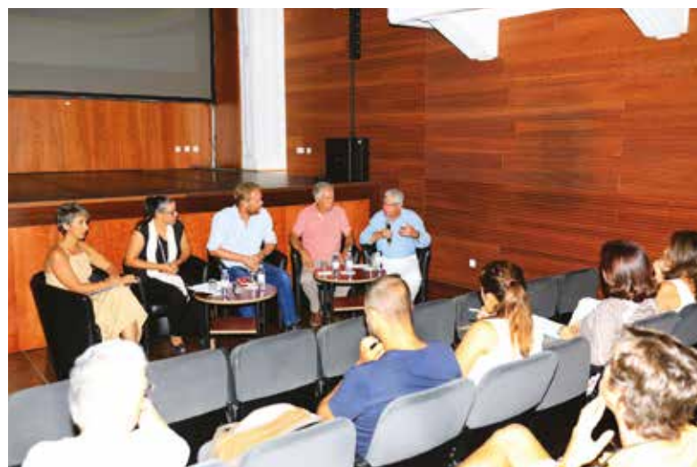
➤ COLÓQUIO "RECURSOS ENDÓGENOS – RAÍZES DO PASSADO COM OLHOS NO FUTURO"