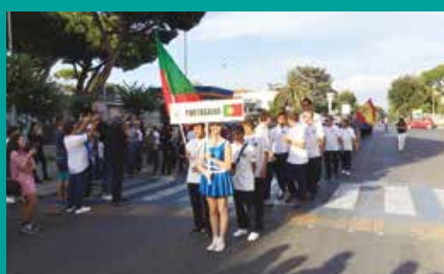
Grândola com três atletas no Campeonato do Mundo de Pesca de Mar Sub 16 e Sub 21