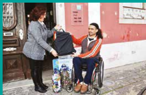
Entrega de Ajudas Técnicas – Projeto Tampas e Caricas