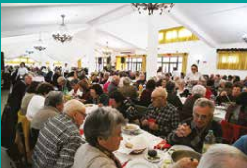
Almoço Sénior – Universidade Sénior e Projeto Viver Solidário