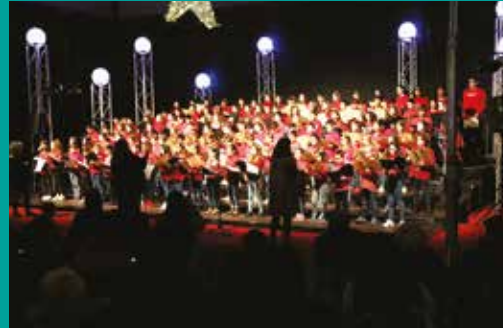
Concerto de Reis