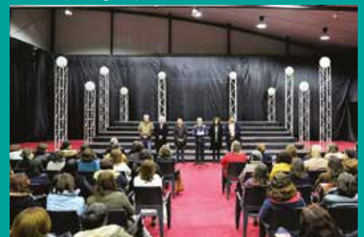
Reunião Geral de Trabalhadores da Câmara Municipal