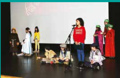
Festa de Natal da Paróquia de Grândola