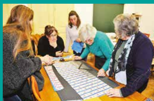
Atelier de Taleigos e Trapologias