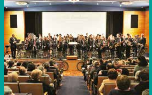
Concerto de Ano Novo da SMFOG