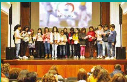
Histórias da Ajudaris – Festa e Apresentação do Livro