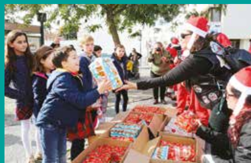
Pais Natal Motards entregam presentes a crianças