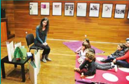
É uma vez ... "Histórias que saltam dos livros"