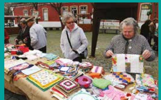
Feira de Natal Solidária da Universidade Sénior