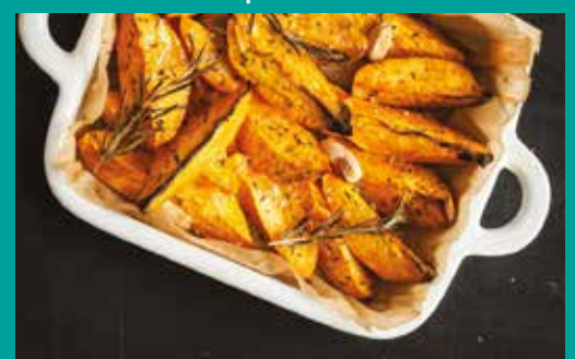
Última semana gastronómica de 2019 apresentou a batata-doce nas ementas