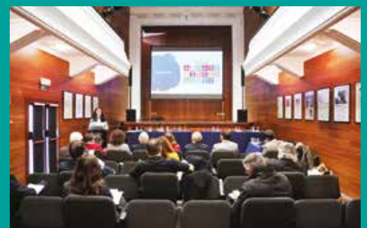
Assembleia Geral da Rede Intermunicipal de Cooperação para o Desenvolvimento