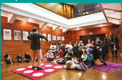
É uma vez... "Biblioteca Extravagante"