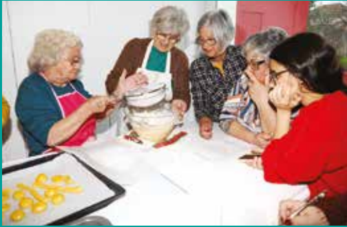
Workshop Bolinhos da Avó na Casa Mostra de Produtos Endógenos