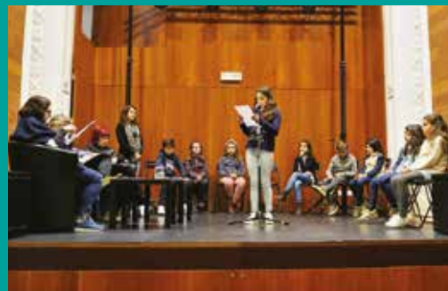
Concurso Nacional de Leitura