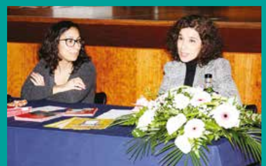
Apresentação da Campanha Periodolive