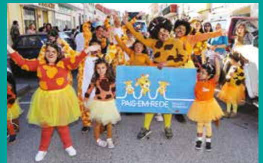
Desfile de Carnaval