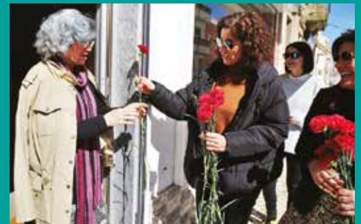
Comemorações do Dia Internacional da Mulher