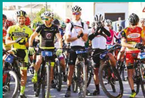
6.ª Maratona BTT "Serras de Grândola"