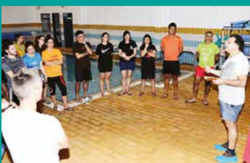
Ação de formação – Natação