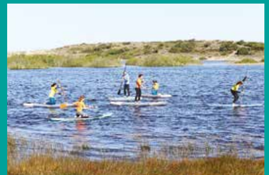
Stand-up Paddle – Mês da Juventude