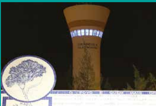
CPCJ – Mês da prevenção dos maus tratos na infância