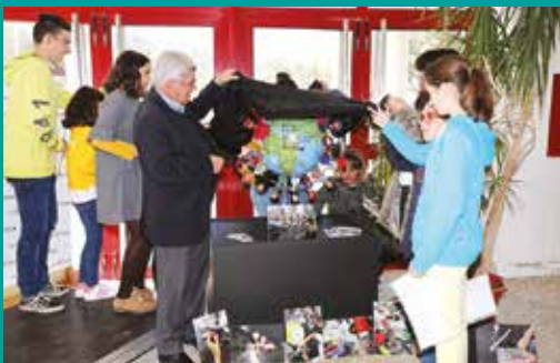
Inauguração Exposição "Somos jovens, somos loucos" – Mês da Juventude