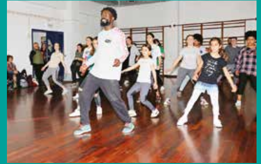
Workshop Dança – Mês da Juventude