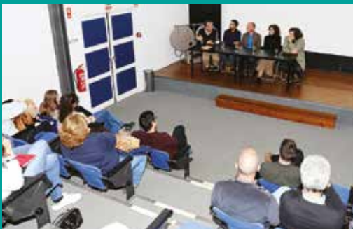
Apresentação Projeto EXTRA!