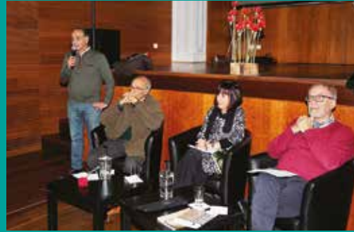
Apresentação do livro "As longas noites de Caxias"