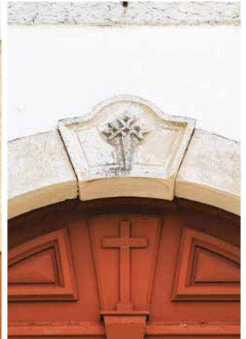
BASE DE COLUNA TARDO-GÓTICA ENCONTRADA QUANDO DA CONSTRUÇÃO DO SALÃO PAROQUIAL DE GRÂNDOLA (1969/1970). CRUZ DA ORDEM MILITAR DE SANTIAGO DA ESPADA QUE ENCIMA O PORTAL DA IGREJA MATRIZ DE GRÂNDOLA.

cipais de guardar e mais três dias da semana porque, em outro modo, não podiam ser sacramentados, que muitos dos vizinhos vivem a muito longe uns dos outros. E a renda com que tinha o dito capelão.