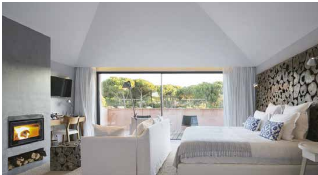
📍 SUBLIME COMPORTA – WELLNESS BOUTIQUE RESORT - CONQUISTOU ESTE ANO O PRÉMIO DE EUROPE'S LEADING BOUTIQUE HOTEL 2020.

📍 O Instituto Nacional de Estatística – I.N.E. divulgou recentemente os dados estatísticos da atividade Turística relativos ao ano de 2019. Grândola volta a apresentar um crescimento significativo na maior parte dos indicadores, continuando a habitual tendência do Concelho com os valores mais elevados da região Alentejo Litoral (NUT III) e Alentejo (NUT II) – precedida em alguns indicadores por Évora, Cidade Património Mundial. A estada média do turista em Grândola, de 2,7 noites, continua a ser substancialmente superior à estada média da região Alentejo (NUT II) de 1,8 noites e mesmo superior à estada média nacional (2,6 noites). Estes valores significam que o concelho de Grândola convida a permanecer para usufruir das inúmeras experiências que tem para oferecer e fazem jus à fraternidade oferecida pelos grandolenses.