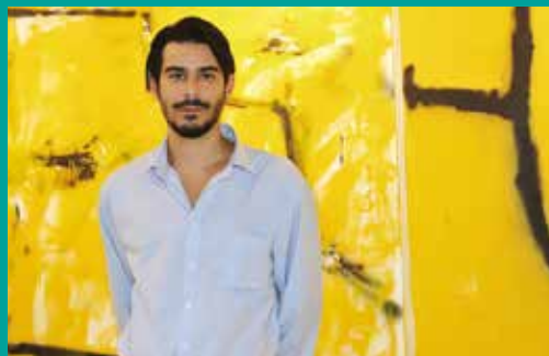
Exposição The Less I See I See The More I Know de Filipe Real Marinheiro