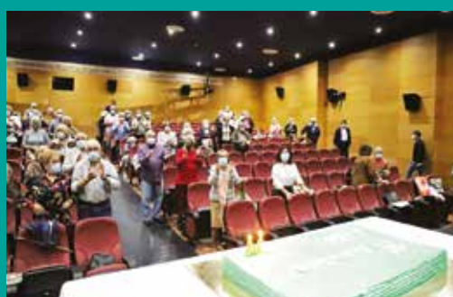
Universidade Sénior de Grândola – 14.º Aniversário