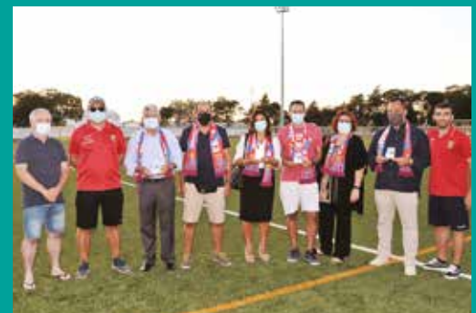
Torneio Manuel Gameiro