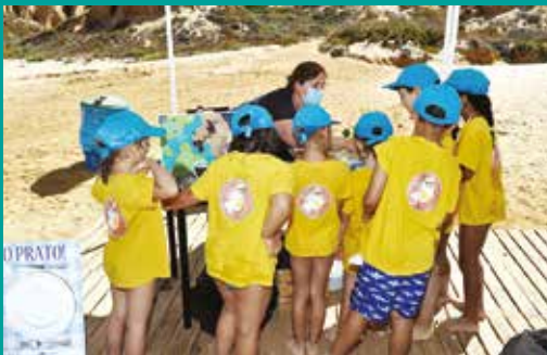
A Mina vai à Praia