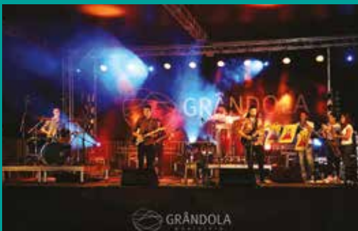
Dia Internacional da Juventude