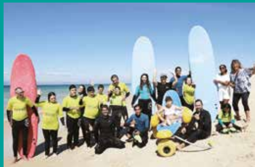
Aula de Surf Adaptado