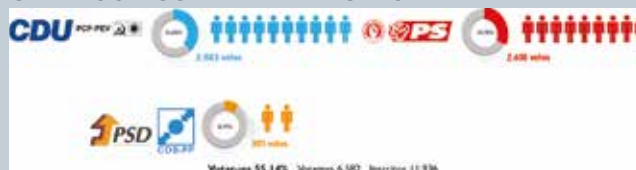
GRÁFICO CÂMARA MUNICIPAL