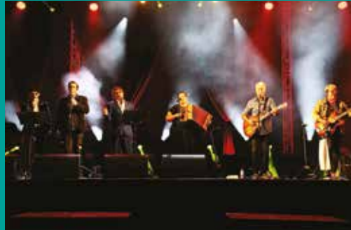
Animação de Verão – Espetáculo Tais Quais