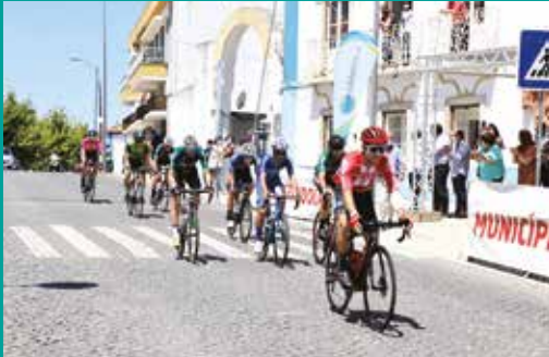
38.ª Volta ao Alentejo em bicicleta