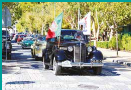
XXVI Viagem Histórica do 1.º automóvel