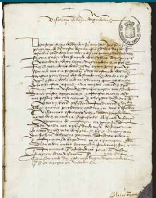
☉ VISITAÇÃO, FÓLIO 3. 14

E assim se guarda e cumpre todas as outras cerimónias da regra, assim os de sua pessoa como os que tocam ao serviço da Igreja (sic). Respondeu a todas estas perguntas que ele as cumpria o melhor que podia e estava prestes para as cumprir segundo sua possibilidade.