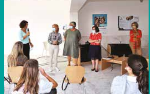
Apresentação do livro – O longo caminho para a igualdade