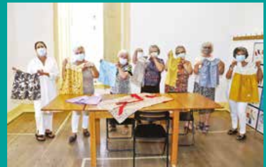
USG – Workshop Dress a Girl