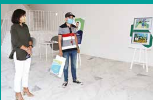
Exposição de ilustração de Francisco Romero