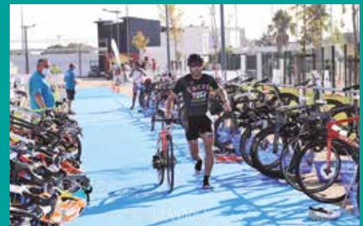
Duatlo de Grândola 2021