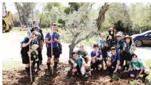
🕒 PLANTAÇÃO DA ÁRVORE DA JUVENTUDE