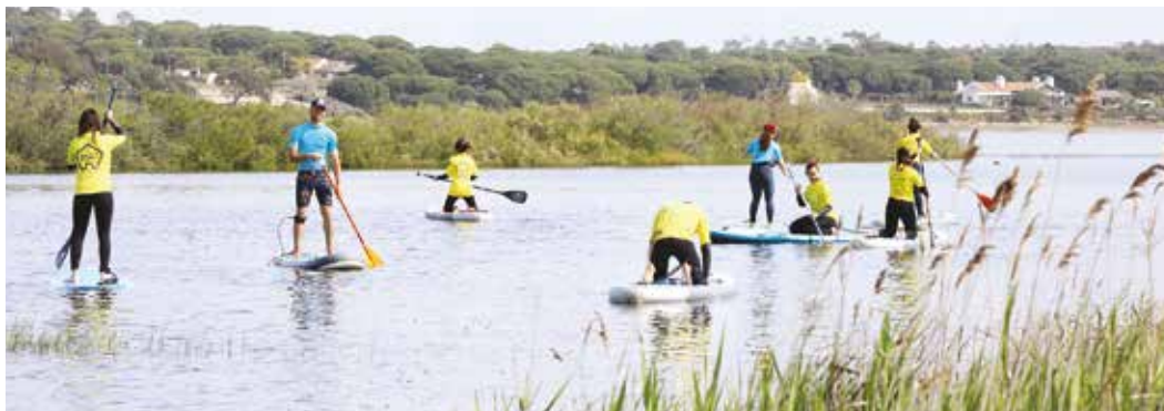
🕒 STAND UP PADDLE – MELIDES