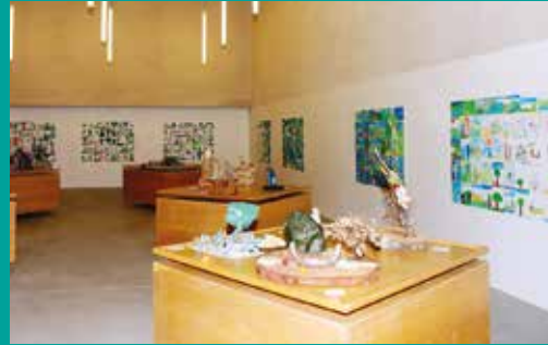
2.ª Sobr'Arte | Concurso de Obras Escultóricas com a temática «Entre a serra e mar»