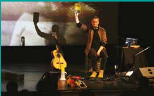
Espectáculo de teatro «Levantei-me do Chão – Lado B»