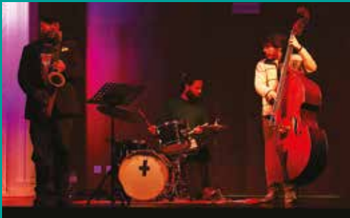
Grândola, Vila Jazz | Bill Shakespeare's, Romeo and Joaolet