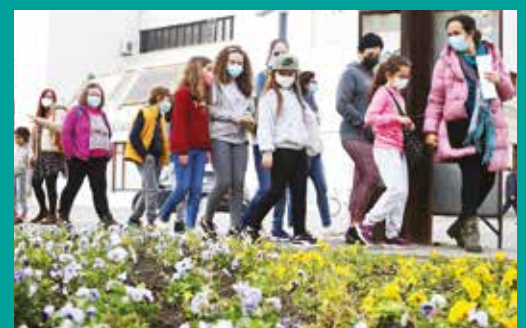
emRaiz'Artes | Uma aventura com a Ludoteca