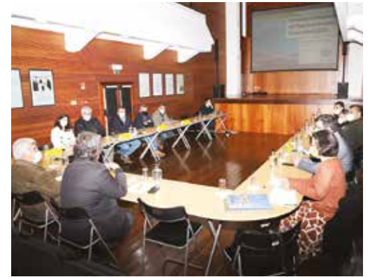
REUNIÃO COM ENTIDADES LIGADAS AO COMÉRCIO