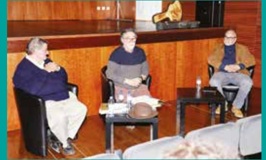
Apresentação do livro “José Afonso – Todas as Canções”