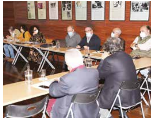
REUNIÃO COM ENTIDADES LIGADAS À AGRICULTURA