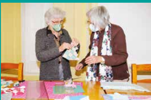
Atelier de Taleigos e Trapologias