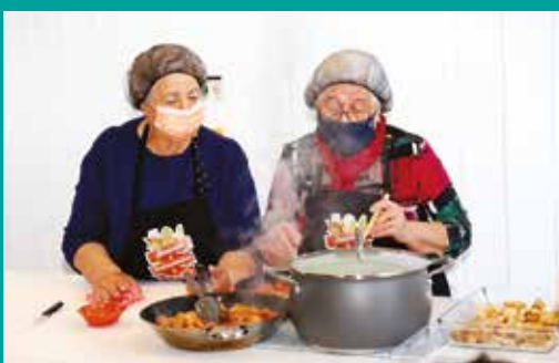
Workshop | Açordas e migas