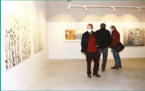
Exposição «Deambulações» | Gravura de Margarida Lourenço e pintura de Acácio Malhador