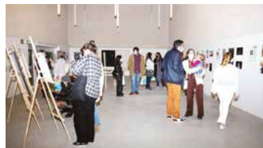
🕒 EXPOSIÇÃO DE ARTE - OBRAS DE JOVENS GRANDOLENSES