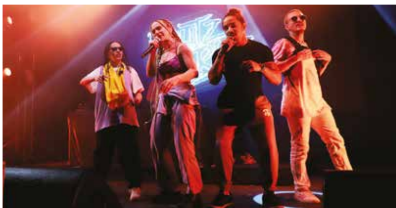
🕒 ESPETÁCULO – PUTZGRILLA

🕒 O Município em parceria com as Juntas de Freguesias, Associações e Instituições, promoveram, durante o mês de março, atividades relacionadas com a prática da atividade física e desportiva, iniciativas de sensibilização do meio ambiente e sustentabilidade, bem como, atividades com temas relacionados com a cidadania e o desenvolvimento pessoal. A rubrica " Conversando com ... ", iniciativa criada durante o mês da Juventude de 2021, marcou presença na edição do MJ 2022 com a partilha de histórias de jovens grandolenses.