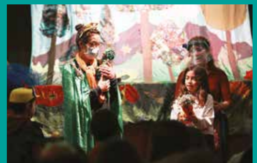
É uma vez... | Sessão de Contos «Salto, Saltinho, Saltão, Cantor de Vocação»