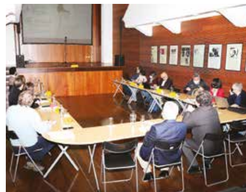
REUNIÃO COM ENTIDADES LIGADAS AO AMBIENTE