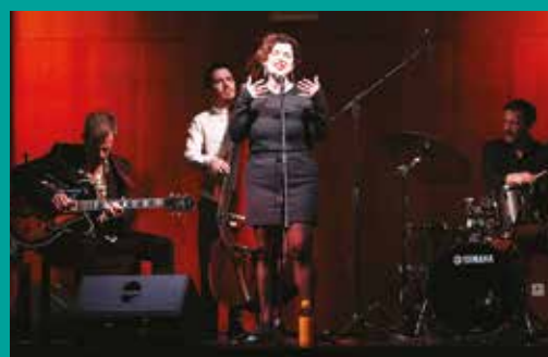
Grândola, Vila Jazz | Just in Trio Quarteto