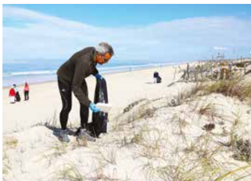
🕒 LIMPEZA DE PRAIA – CARVALHAL