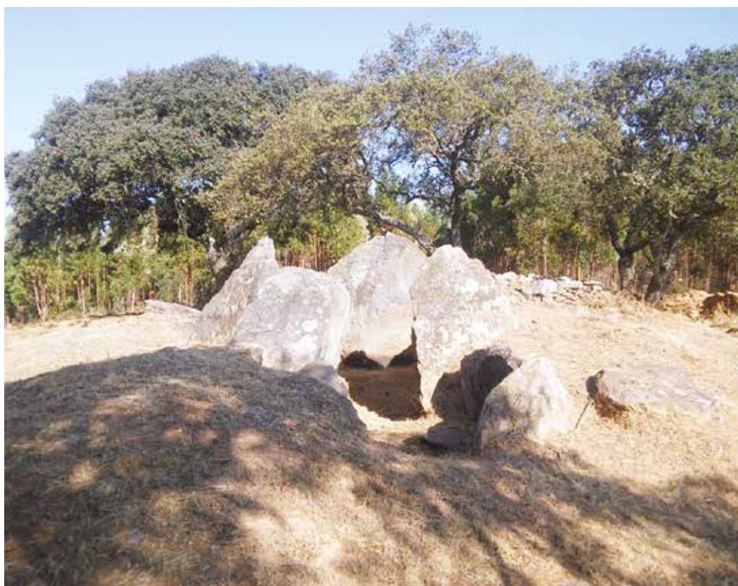
🕒 MONUMENTO MEGALÍTICO DA PATA DO CAVALO – FREGUESIA DE AZINHEIRA DOS BARROS