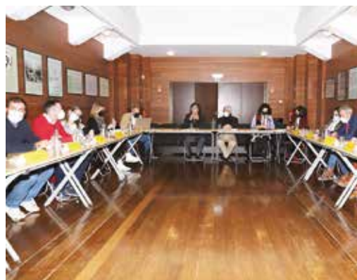
REUNIÃO COM ENTIDADES LIGADAS AO SOCIAL