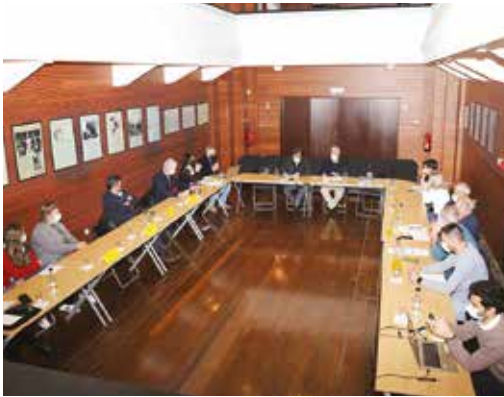
REUNIÃO COM ENTIDADES LIGADAS À INDÚSTRIA