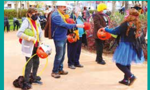
Carnaval Sénior | 125 seniores participaram na iniciativa