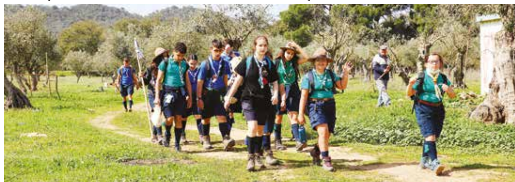
🕒 CAMINHADA DA JUVENTUDE