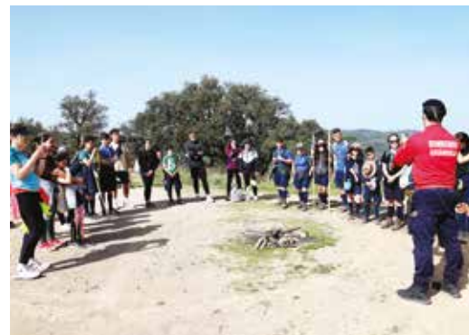
🕒 OFICINA PRIMEIROS SOCORROS