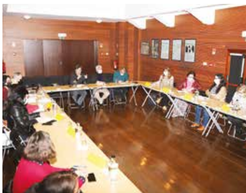
REUNIÃO COM ENTIDADES LIGADAS À EDUCAÇÃO