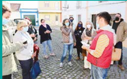
Workshop | Vamos criar GeoCaches!