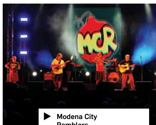
▶ Modena City Ramblers