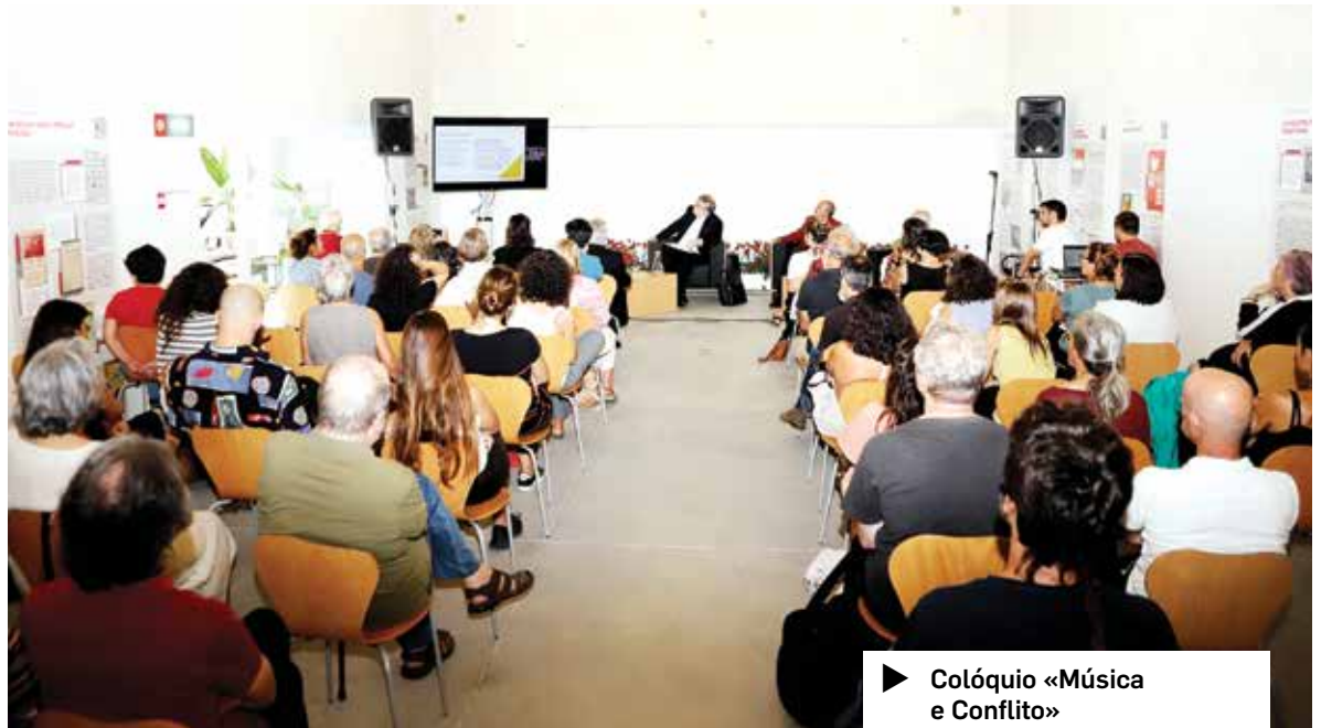
▶ Colóquio «Música e Conflito»

O Encontro da Canção de Protesto resulta da atividade do Observatório da Canção de Protesto – organismo constituído pelo Município de Grândola, entidade promotora, a Associação José Afonso, a Sociedade Musical Fraternidade Operária Grandolense, e os institutos da Faculdade de Ciências Sociais e Humanas da Universidade Nova de Lisboa nomeados Centro de Estudos de Sociologia e Estética Musical, Instituto de Etnomusicologia – Centro de Estudos em Música e Dança e Instituto de História Contemporânea.