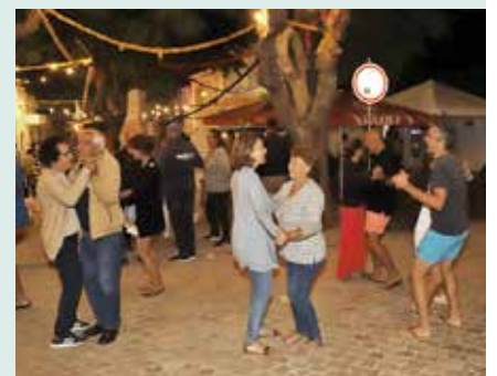
► FREGUESIAS | Melides – Festas de Nossa Senhora do Rosário