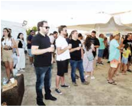
► TURISMO | Sunset Cerveja à Meia Tarde