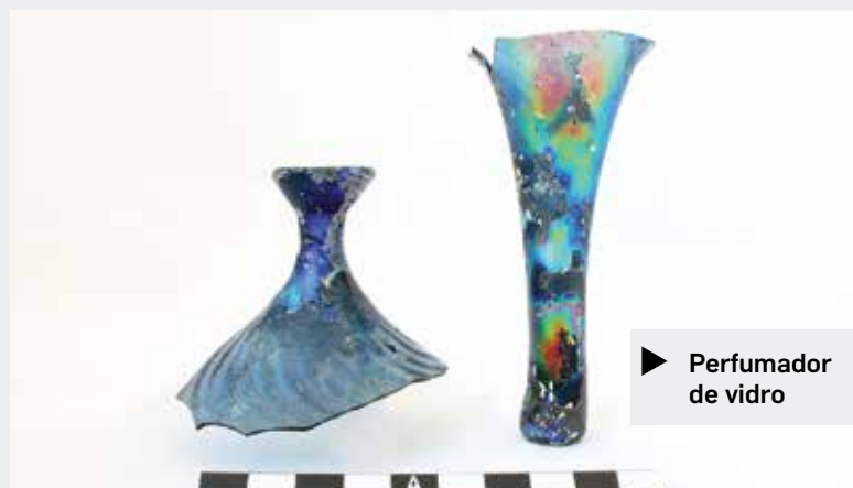
▶ Perfumador de vidro

decorado) e fragmentos de vasilhas associadas às tarefas de transporte e armazenamento (cântaros). Importa destacar a presença de cerâmicas mais requintadas, como aquelas que exibem vidrados (verde ou melado), esmaltados (branco) ou decoração em corda seca – que deverão ser provenientes, na sua maioria, de oficinas sevilhanas –, assim como um pequeno fragmento de porcelana chinesa, pertencente ao período Wanli (1572-1620) da dinastia Ming.