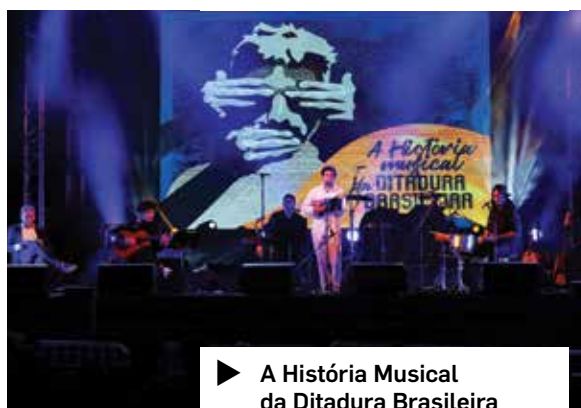
▶ A História Musical da Ditadura Brasileira