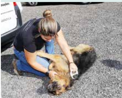
► CASA 4PATAS | Campanha de Vacinação Antirrábica