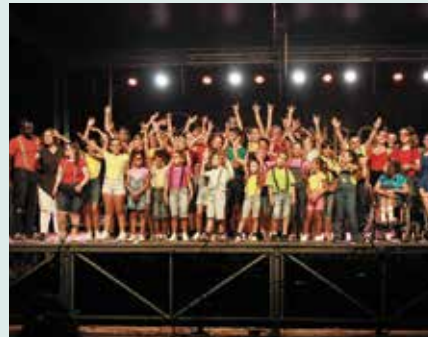
► ASSOCIATIVISMO | Espetáculo Inclusivo Puzzle – Associação Pais em Rede