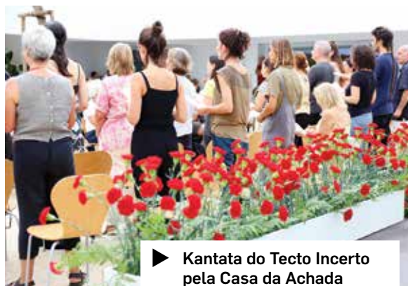
▶ Kantata do Tecto Incerto pela Casa da Achada