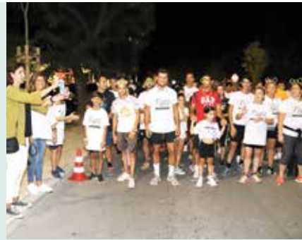
► JUVENTUDE | Dia Internacional da Juventude – Night Run