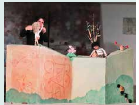
► CULTURA | É uma vez... «A viagem de Mustafá»