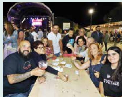
► FREGUESIAS | Carvalhal – Feira de São Romão