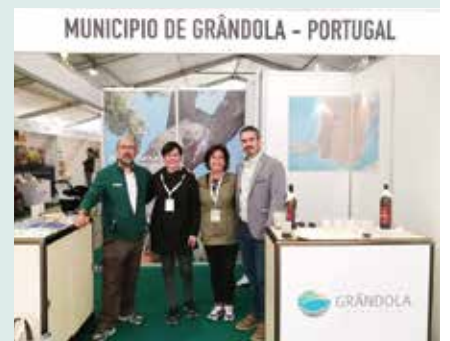
► TURISMO | Município participou na NATURCYL – Feira de Ecoturismo de Castilla y León