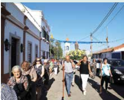
► FREGUESIAS | Azinheira dos Barros – Procissão em honra de Nossa Senhora da Conceição