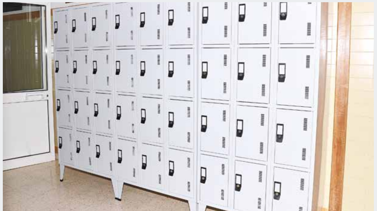
▶ OS ALUNOS DA EB 2,3 DE GRÂNDOLA TÊM AGORA DISPONÍVEIS NOVOS CACIFOS.

cado por um novo modelo de gestão, no âmbito da transferência de competências na área da Educação. O município assume, atualmente, um conjunto de competências, anteriormente da responsabilidade do Estado, com o compromisso de prestar um melhor serviço à comunidade educativa.