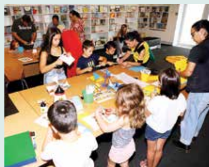
► CULTURA | Sábados na Biblioteca