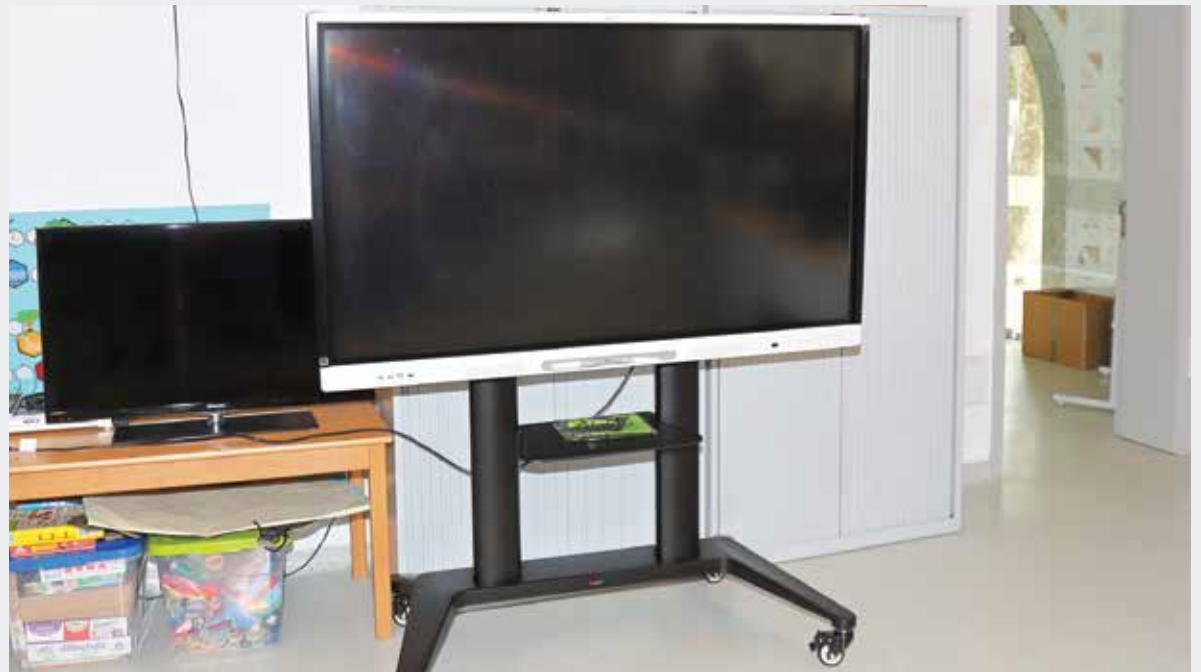
▶ O PARQUE ESCOLAR CONTA COM MELHORIAS E COM NOVOS EQUIPAMENTOS, DESTACANDO-SE QUADROS INTERATIVOS.