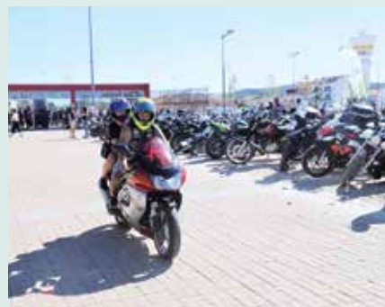
► ASSOCIATIVISMO | 2ª Concentração de Motos do Moto Clube de Grândola