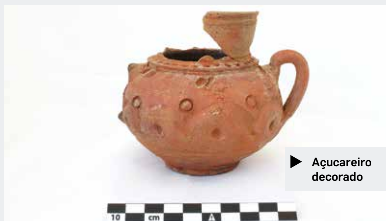
▶ Açucareiro decorado