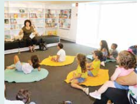
► CULTURA | É uma vez... «Contos de lá e de cá»