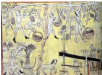
Illuminura do Apocalipse do Lorvão, séc. XII.