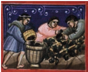
Illuminura do Missal do Lorvão, séc. XV.

Villa esta oje mui Authorizada e acrescentada de muitas bem feitorias que de junto de sy tem huma varzia de Vinhas muito grandioza que he o meneio della donde todos se sustentam por serem de muito proveito e vay em muito crescimento por terem terras pera se porem muito mais do que estam. Já no século XVIII, Carvalho da Costa, na obra Corografia Portuguesa de 1712, descreveu a várzea afirmando que o rio Davino atravessa huma fermosa varzea de vinhas com 1300 milheiros de pés, muito proveitosos e de baixo custo de produção, que ocupava cerca de uma légua e se encontrava vedada por um muro com quatro portas para serventia.