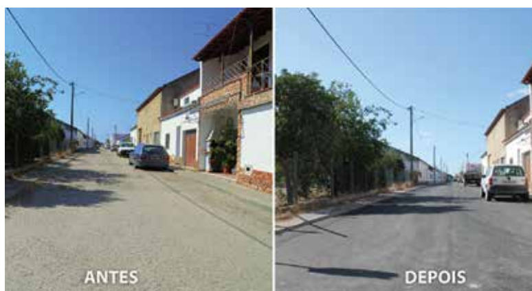
RUA 25 DE ABRIL (ISAÍAS)