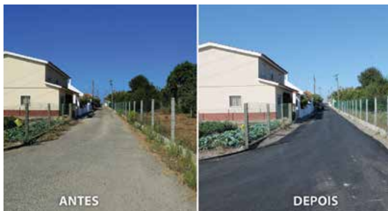
RUA GENERAL HUMBERTO DELGADO (TIRANA)