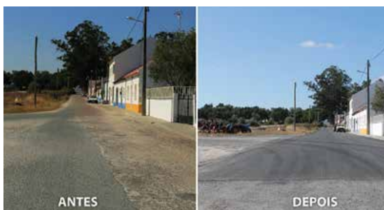
RUA 1º DE MAIO (ISAÍAS)