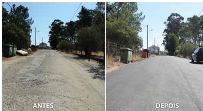
RUA 22 DE JANEIRO (ISAÍAS)