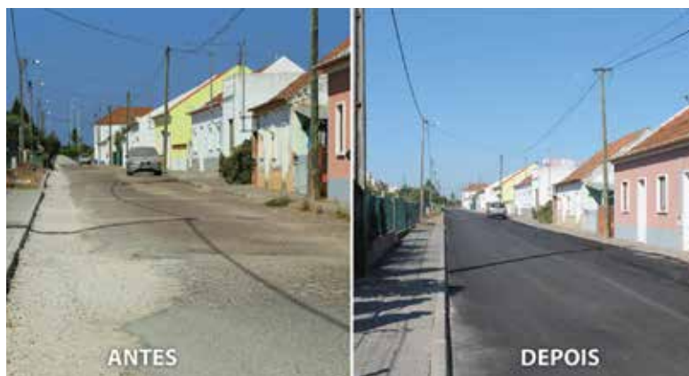
RUA DR. EVARISTO SOUSA GAGO (TIRANA)