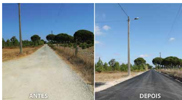
RUA B (BAIRRO DA LINHA)