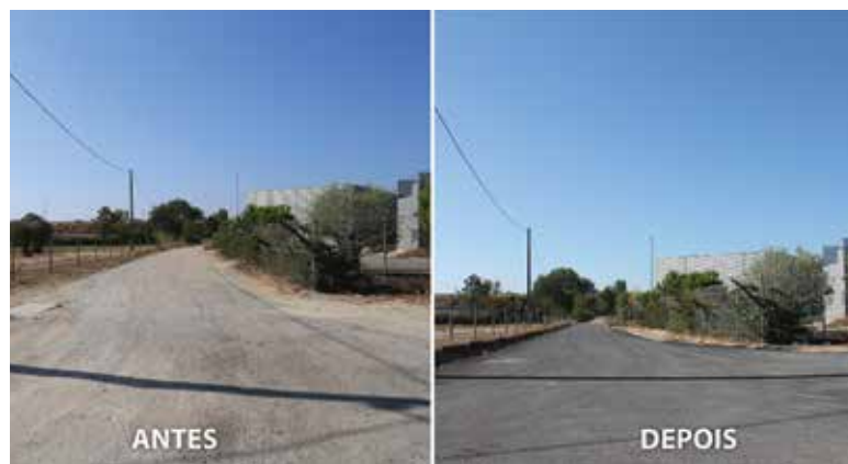
ACESSO IC1 (TIRANA)