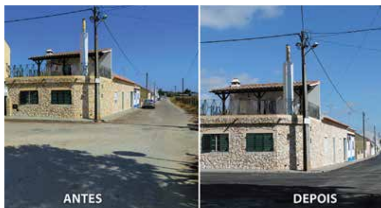
RUA 22 DE JANEIRO / RUA 1º DE MAIO (ISAÍAS)