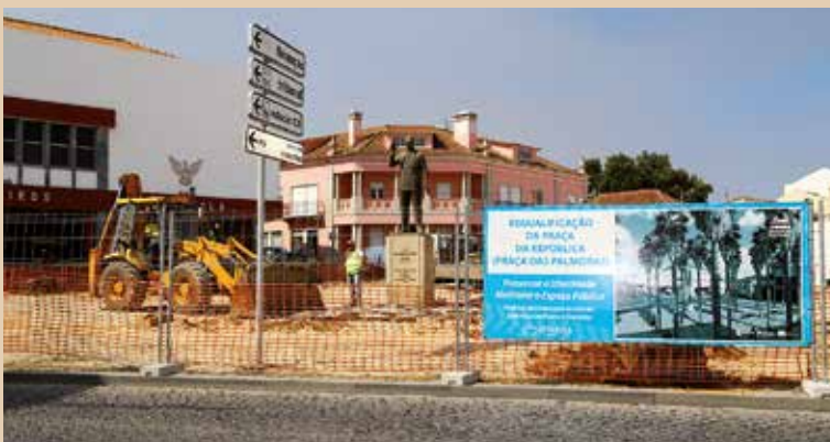
PRAÇA DA REPÚBLICA (PRAÇA DAS PALMEIRAS)