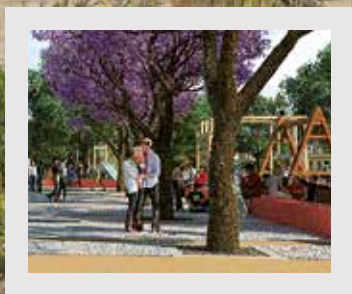
REQUALIFICAÇÃO DO JARDIM 1º DE MAIO PÁGINAS 4 E 5