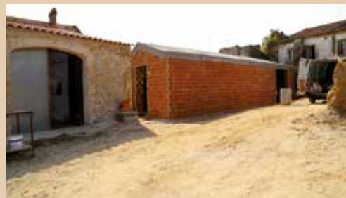
CASA MOSTRA DOS PRODUTOS ENDÓGENOS