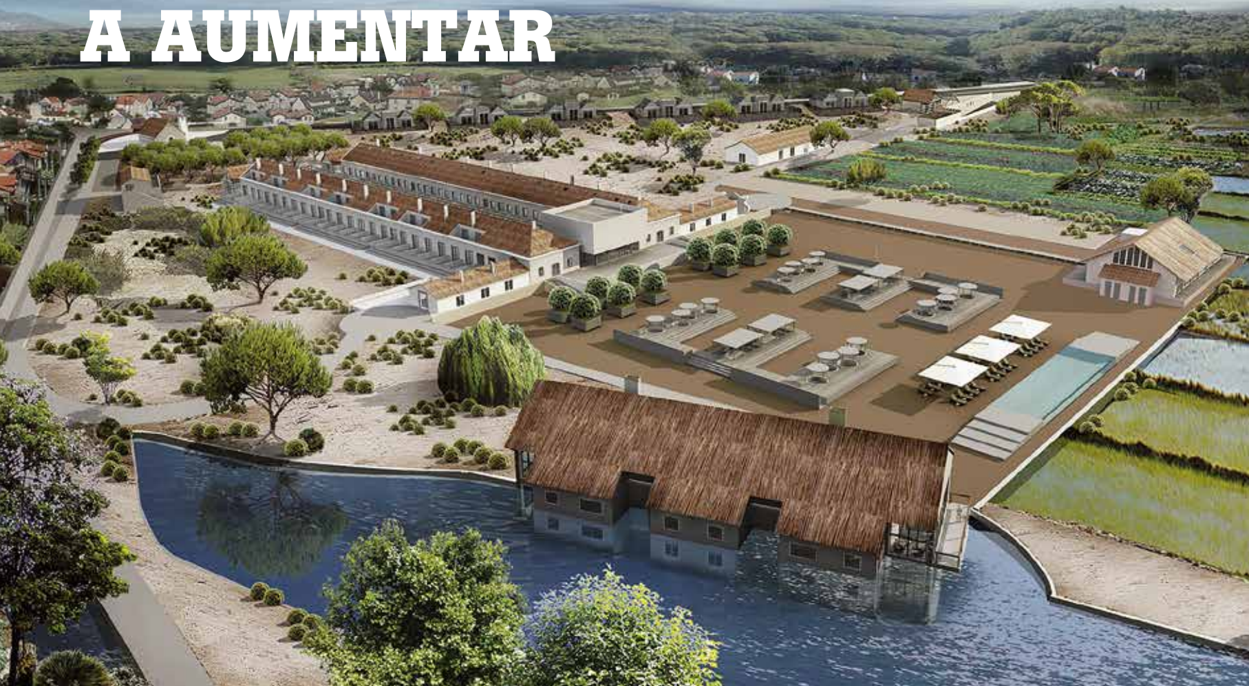
QUINTA DA COMPORTA – CARVALHAL

O concelho de Grândola está com um forte investimento privado na área do Turismo, principalmente estrangeiro. Conheça quatro novos projetos que estão em desenvolvimento e que irão contribuir para o desenvolvimento económico e para a criação de postos de trabalho.