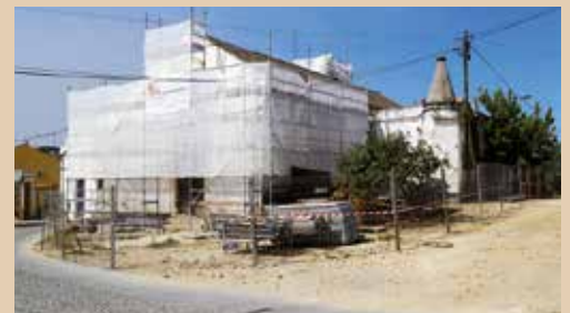
IGREJA DE SÃO PEDRO