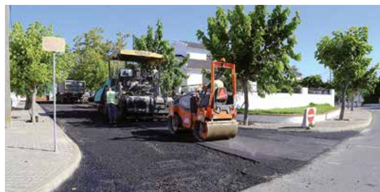
MELIDES – TRAVESSA ANTÓNIO ALEIXO

A Câmara Municipal de Grândola continua a requalificar a rede viária mais degradada, um pouco por todo o Concelho. Neste sentido, concluiu recentemente os trabalhos em Canal Caveira e estão em fase final os trabalhos no Carvalho e em Melides. Avançará a curto prazo mais quatro empreitadas, que incluem intervenções no Bairro do Arneiro, Bairro de São João, Bairro Vale Pereiro, Cerrado das Aranhas, novo Quartel dos Bombeiros e outras zonas do Centro da Vila.