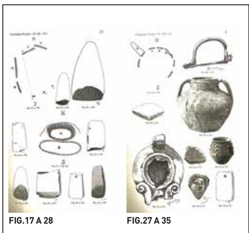
FIG.17 A 28