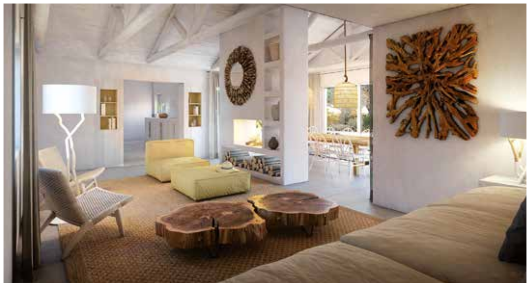
TOWHOUSE INTERIOR – LA RESERVE CARVALHAL

Localizado na aldeia do Carvalho, na Herdade da Comporta, o La Réserve é o primeiro projeto do grupo francês Térresens em Portugal, tendo sido criado e desenvolvido em parceria com a Pátria Imobiliário, uma empresa de serviços e consultoria estratégica imobiliária portuguesa, que tem como principal atividade o acompanhamento de investimento imobiliário estrangeiro em Portugal. O projeto desenvolver-se-á num terreno urbano com uma área de 10 hectares, estando previstos cerca de 23.000 m 2 de construção, que incluem apartamentos, casas integradas num conceito de vila alentejana e villas, com preços que vão dos € 200 000 aos 1,6 milhões de euros. O La Réserve oferece aos futuros proprietários uma gestão integrada das suas unidades, podendo ser entregue à gestão para aluguer do imóvel, atingindo os 5% de rentabilidade depois de despesas. Outros serviços como jardinagem, manutenção da casa e piscina, room-service, babysitting e outros estarão à disposição dos proprietários.