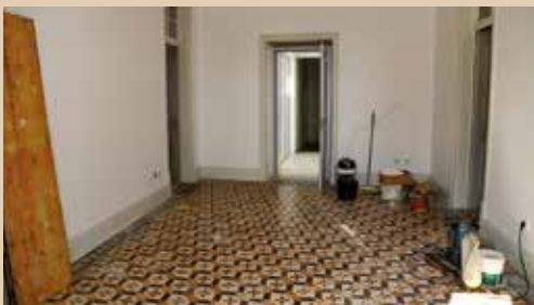
CASA LUIS DIAS