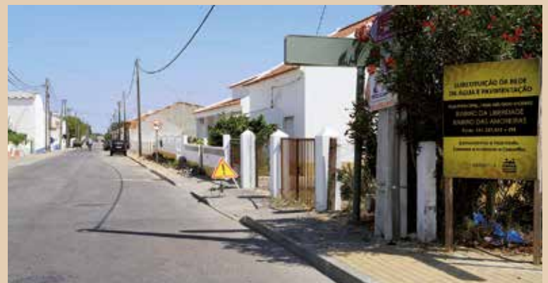
REDE DE ÁGUAS E PAVIMENTAÇÃO - BAIRRO DA LIBERDADE/AMOREIRAS