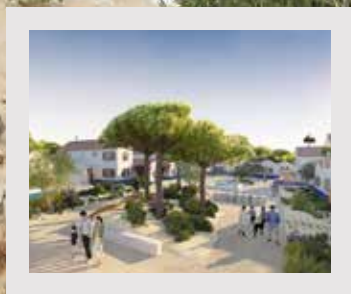
INVESTIMENTO PRIVADO NO CONCELHO CONTINUA A AUMENTAR PÁGINAS 8 E 9