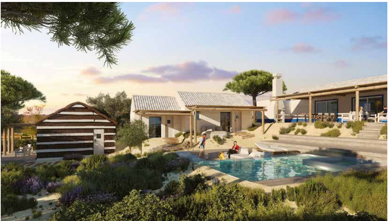
VILLA EXTERIOR – LA RESERVE CARVALHAL