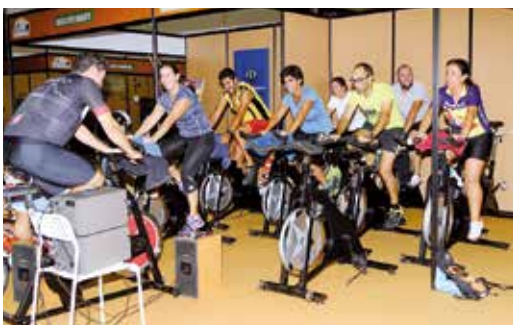
AULA DE SPINNING