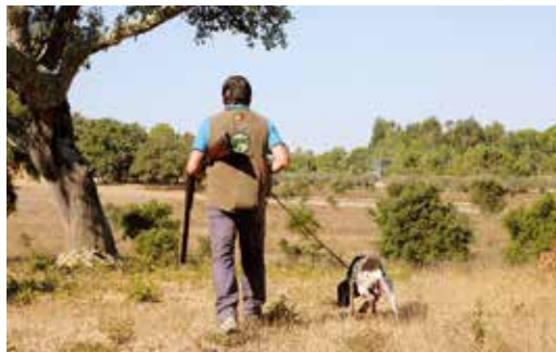
PROVA DE SANTO HUBERTO