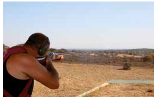
TORNEIO DE TIRO AOS PRATOS