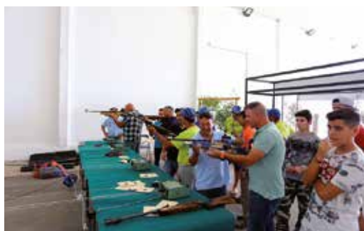
PRÁTICA DE TIRO DE RECREIO