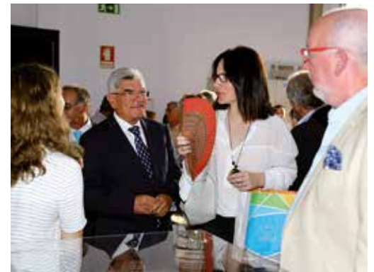
VISITA AOS PAVILHÕES DE EXPOSITORES