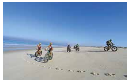
2.ª TRAVESSIA FATBIKE