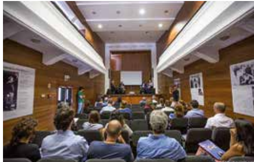
COLÓQUIO TURISMO E PATRIMÓNIO CULTURAL