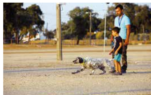
DEMONSTRAÇÃO DE CÃES DE PARAR