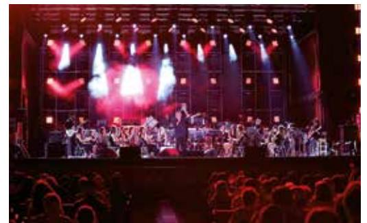
ESPETÁCULO BANDA DA SMFOG E SÉRGIO GODINHO