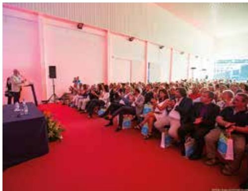
CERIMÓNIA DE INAUGURAÇÃO

Ao longo dos cinco dias do certame, Grândola Vila Morena foi ponto de paragem para milhares de visitantes que acorreram à grande festa do Litoral Alentejano que destacou nesta edição o Património Arqueológico, uma das principais riquezas do Concelho, com a exposição "Grândola Arqueológica – Território e Ocupação" que esteve patente ao público no pavilhão 1 de expositores e que apresentou uma cronologia compreendida entre o Mesolítico e o Período contemporâneo pretendendo dar a conhecer as principais estações arqueológicas do Concelho. A Praça Rural, o artesanato e gastronomia variada presente no evento não deixaram os milhares de turistas e grandolenses indiferentes à qualidade aliada à tradição, assim como o vasto programa de