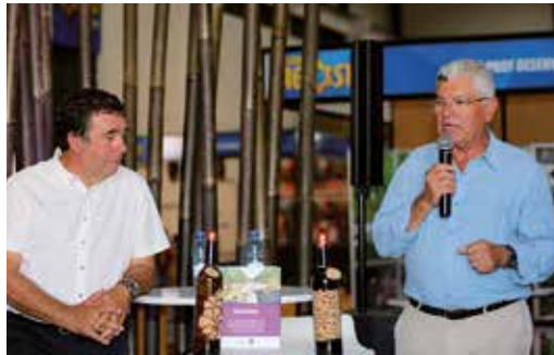
APRESENTAÇÃO DO LIVRO TERRITÓRIOS VINHATEIROS DE PORTUGAL