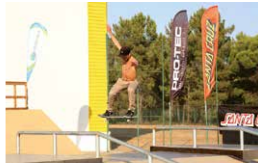
CAMPEONATO DE SKATE