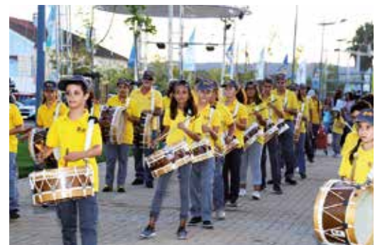
ANIMAÇÃO DE RUA RUFAR & BOMBAR