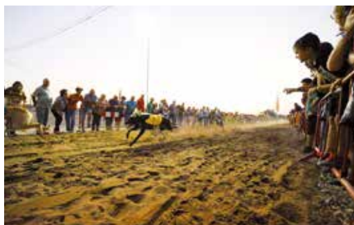
2.ª CORRIDA DE GALGOS EM PISTA