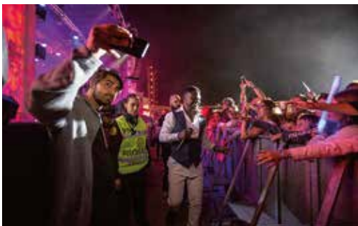
ESPETÁCULO MATIAS DAMÁSIO