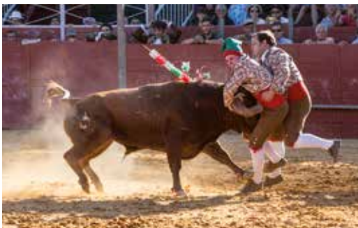
CORRIDA DE TOUROS