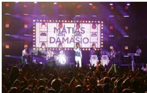
ESPETÁCULO MATIAS DAMÁSIO