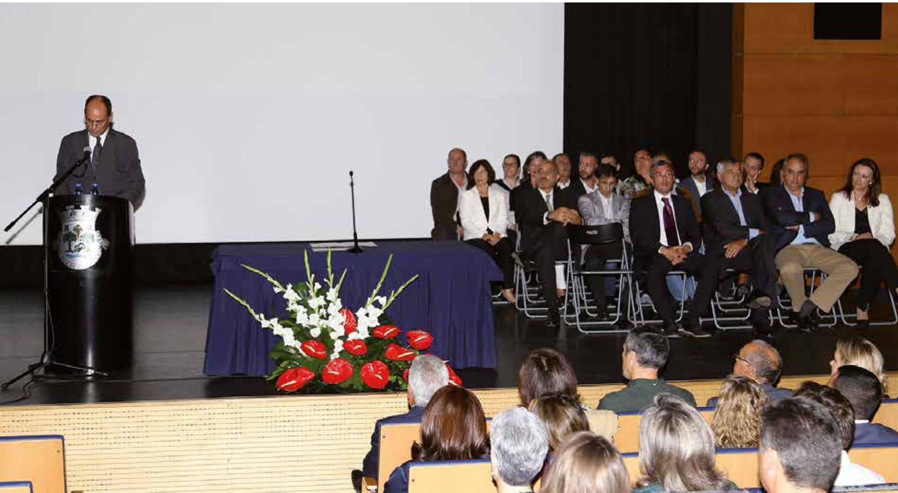
TOMADA DE POSSE DA ASSEMBLEIA MUNICIPAL DE GRÂNDOLA

do novo Quartel dos Bombeiros, bem como a requalificação do Cemitério de Grândola, a reconstrução do Centro Comunitário de Água Derramada, a construção do Centro Comunitário da Aldeia do Pico e do recinto multidesportivo de Melides. Lançaremos os procedimentos para as seguintes empreitadas: Requalificação das estradas de acesso à Cilha do Centeio e às Sobreiras Altas, requalificação do Jardim 1º de Maio e da Olaria de Melides e concluiremos o projeto para requalificar a avenida Jorge Nunes". Num discurso voltado para o futuro, o Presidente da Câmara, revelou ainda que "além do grande investimento público que, ao nível da Câmara, irá ter lugar nos próximos anos, ao nível do investimento privado, muito dele estrangeiro, irão iniciar-se no próximo ano, investimentos na Indústria, no Imobiliário e no Turismo, a rondar os 200 milhões de euros".