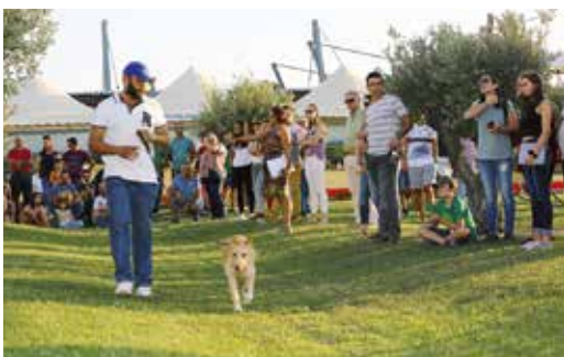
CONCURSO DE PODENGOS