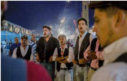
ANIMAÇÃO DE RUA GRUPO CORAL DE BEJA