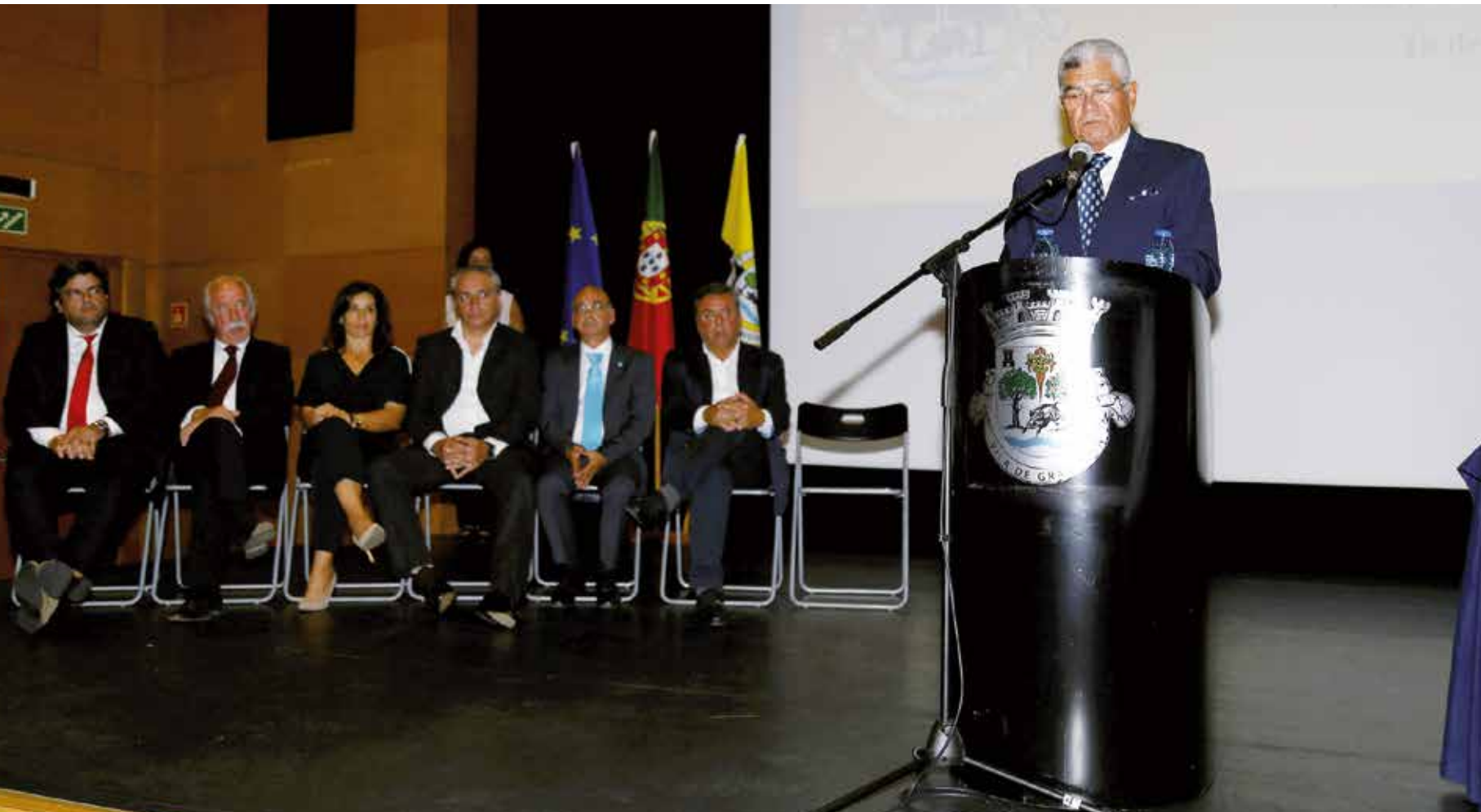
TOMADA DE POSSE DO NOVO EXECUTIVO DA CÂMARA MUNICIPAL DE GRÂNDOLA