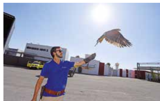
DEMONSTRAÇÃO DE FALCOARIA