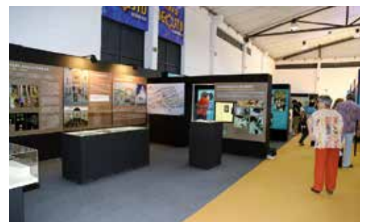
EXPOSIÇÃO DE ARQUEOLOGIA