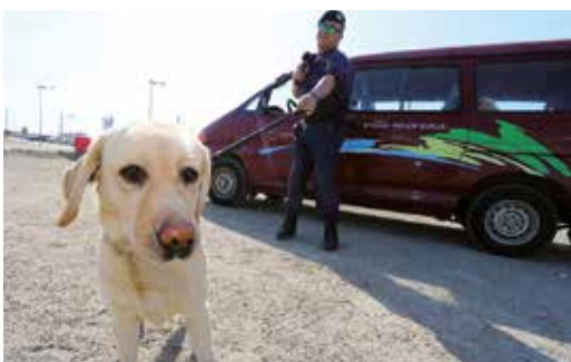
DEMONSTRAÇÃO CINOTÉCNICA - GNR