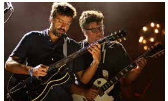
ESPETÁCULO MIGUEL ARAÚJO