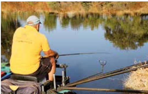
CONCURSO DE PESCA DESPORTIVA DE RIO