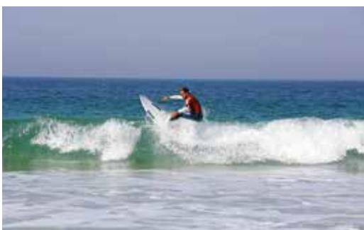
ALENTEJO SURF "LONGBOARD CUP 2017"