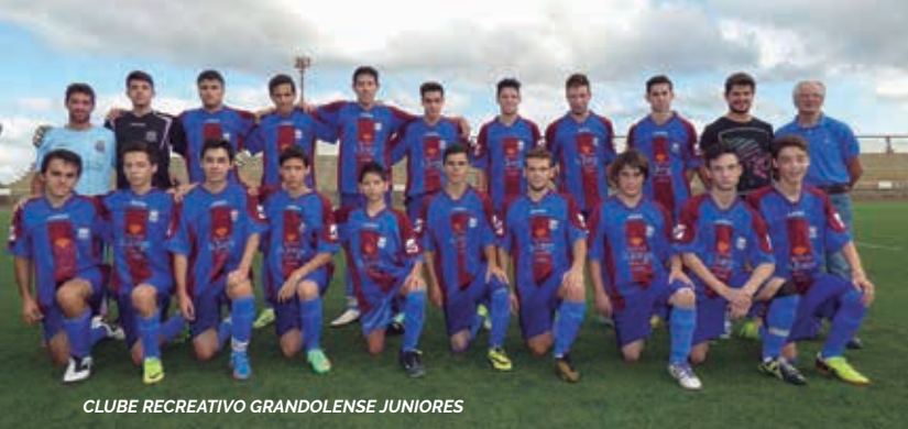
CLUBE RECREATIVO GRANDOLENSE JUNIORES