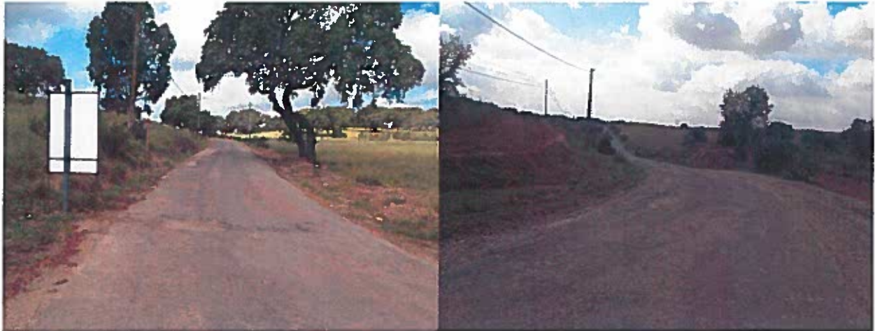
Foto 2 e 3 – Alguns aspectos da estrada, nas zonas de saneamentos

Assim, para a reparação desta estrada prevê-se a execução de bermas com 0.50 em cada lado da estrada e a regularização das valetas. Para a execução das bermas, será feita abertura de caixa, com 0.10 e a aplicação duma camada de tout-venant com 0.15 após recalque.