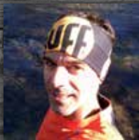
PADRINHO DA PROVA