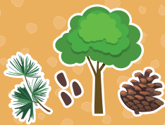
Pinheiro manso Pinus pinea