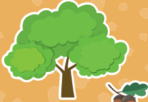
Azinheira Quercus rotundifolia