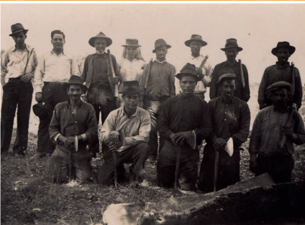
Rancho de tiradores de cortiça

Mais nove anos e faz-se a terceira extração . Esta cortiça, de qualidade superior, é designada por amadia . Por esta altura a árvore tem cerca de 50 anos . A longevidade média do sobreiro é 200 anos .