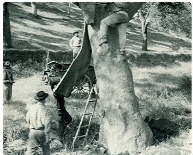
Tiragem da cortiça