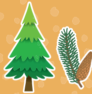
Pinheiro bravo Pinus pinaster