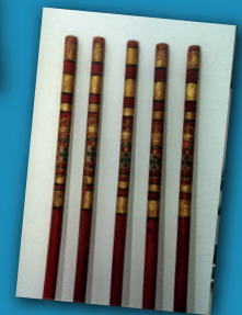
Varas dos vereadores