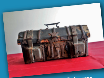
Cofrinho dos Pelouros