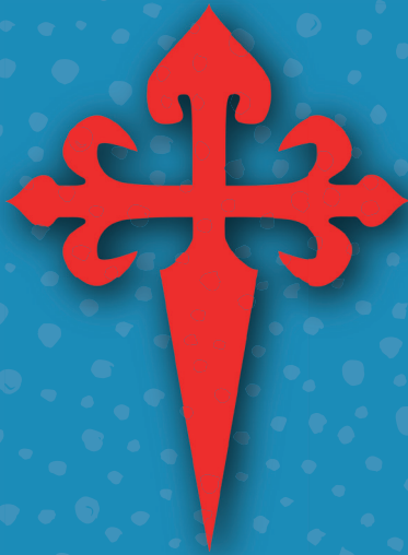
Cruz da Ordem Militar de Santiago da Espada