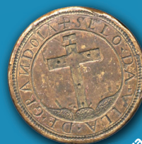
Selo da câmara