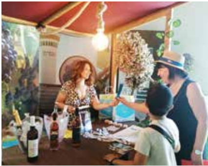
► TURISMO | Grândola marcou presença na 58ª Feira Nacional de Agricultura