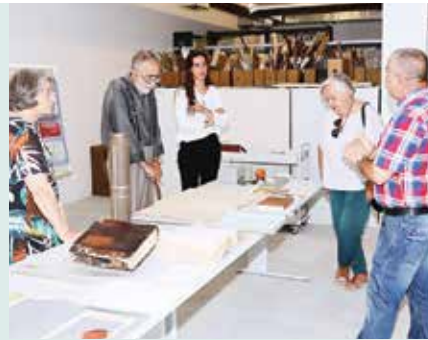
► PATRIMÓNIO | Visitas guiadas ao depósito do Arquivo Municipal