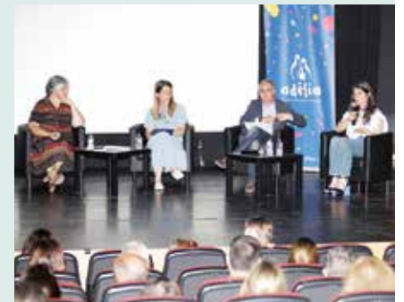
► SOCIAL | Apresentação pública do Projeto Adélia