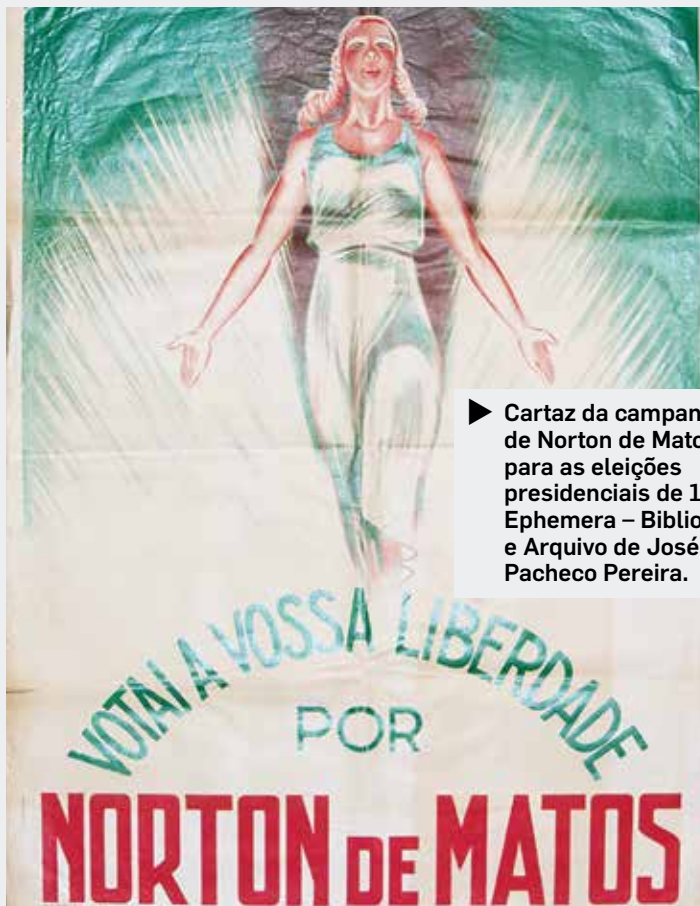
► Cartaz da campanha de Norton de Matos para as eleições presidenciais de 1949, Ephemera – Biblioteca e Arquivo de José Pacheco Pereira.

Em julho de 1948, o General José Maria Mendes Ribeiro Norton de Matos 2 (Ponte de Lima, 1867 – Ponte de Lima, 1955) anunciou a sua candidatura à presidência da República, em oposição ao Marechal António Óscar Carmona 3 , com o apoio de uma força heterogénea