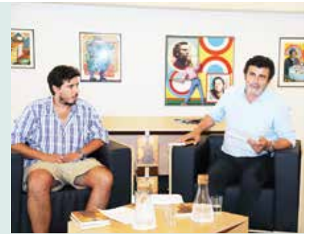
► CULTURA | Apresentação do livro "Comboio na Duna" de Silvério Manata