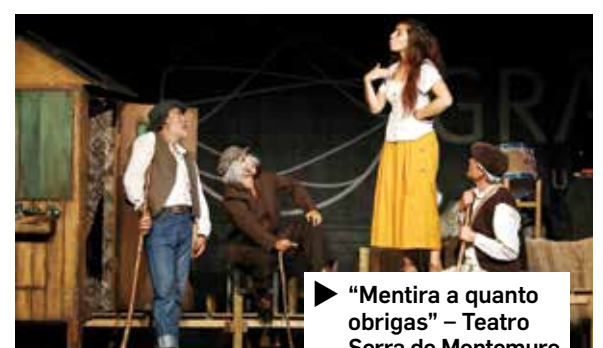
▶ "Mentira a quanto obrigas" – Teatro Serra de Montemuro