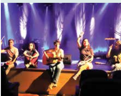
► CULTURA | Espetáculo Mais Alto