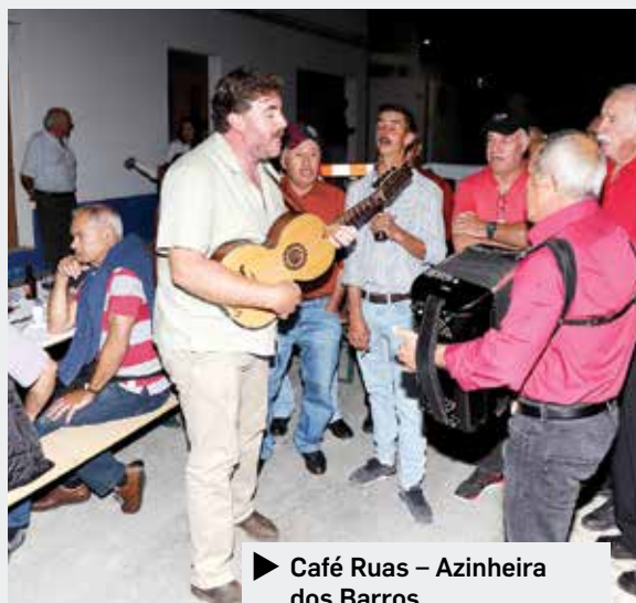
► Café Ruas – Azinheira dos Barros