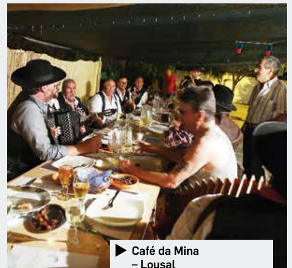
► Café da Mina – Lousal