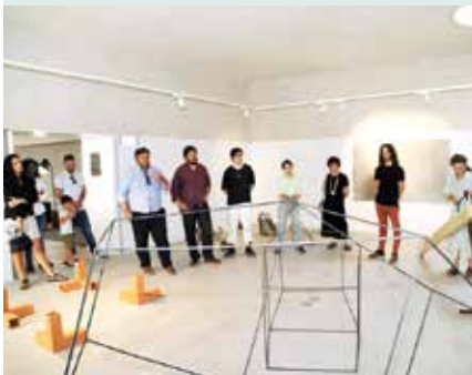
► ARTE | Exposição de Escultura "À Superfície" – Alunos da Faculdade de Belas Artes Univ. Lisboa