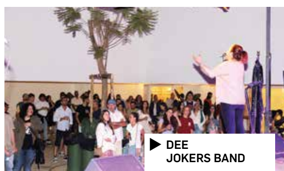
▶ DEE JOKERS BAND