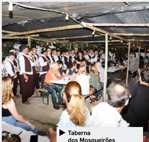
► Taberna dos Mosqueirões