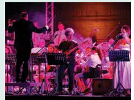
► CULTURA | Concerto – John Wesley Harding