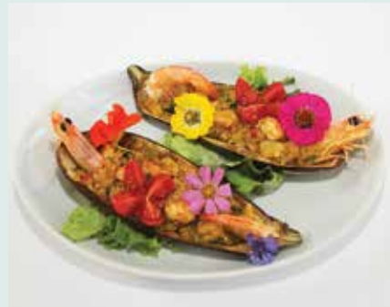
► GASTRONOMIA | Semanas Gastronómicas - Ementas com flores