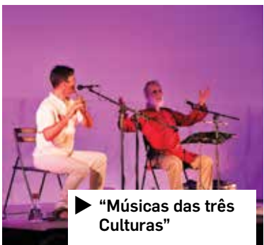
► “Músicas das três Culturas”