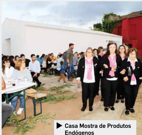
► Casa Mostra de Produtos Endógenos

■ «MUTABILIA» um espetáculo de teatro físico e circo contemporâneo pelo Teatro do Mar, de Sines, marcou o arranque da Animação de Verão, no Jardim 1.º de Maio, no dia 1 de julho. Seguiram-se o Festival de Folclore do Rancho Folclórico 5 Estrelas de Abril, o Encontro de Bandas Juvenis, teatro com a peça «Mentira a Quanto Obrigas», pelo Teatro Regional da Serra de Montemuro, e a encerrar a programação, o espetáculo com os Adiafa. A animação na Biblioteca começou a 2 de julho com as comemorações do 1º aniversário da Biblioteca e Arquivo do Município de Grândola. Exposições, concertos, cinema ao ar livre e literatura marcaram o mês.