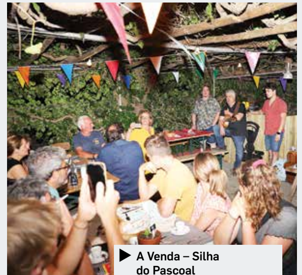
► A Venda – Silha do Pascoal