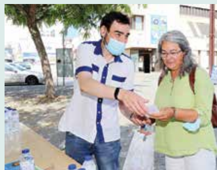
► SAÚDE | Ação de sensibilização sobre a importância da água