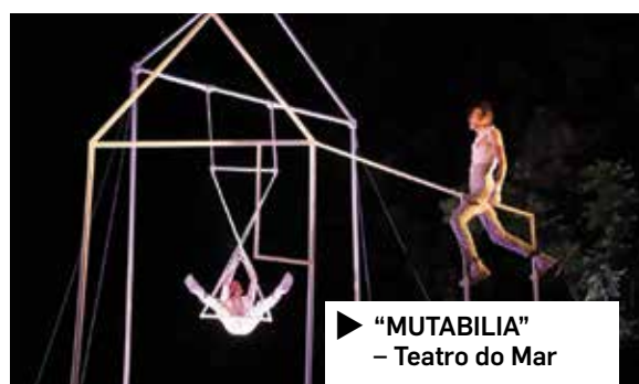
▶ "MUTABILIA" – Teatro do Mar

O município, no âmbito da estratégia cultural que tem vindo a implementar, preparou para julho um vasto programa de Animação de Verão com iniciativas que decorreram no renovado e agradável Jardim 1º de Maio e no pátio central do premiado edifício da Biblioteca e Arquivo do Município de Grândola.