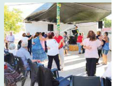
► ENVELHECIMENTO ATIVO | Atividades de Encerramento – Arraial