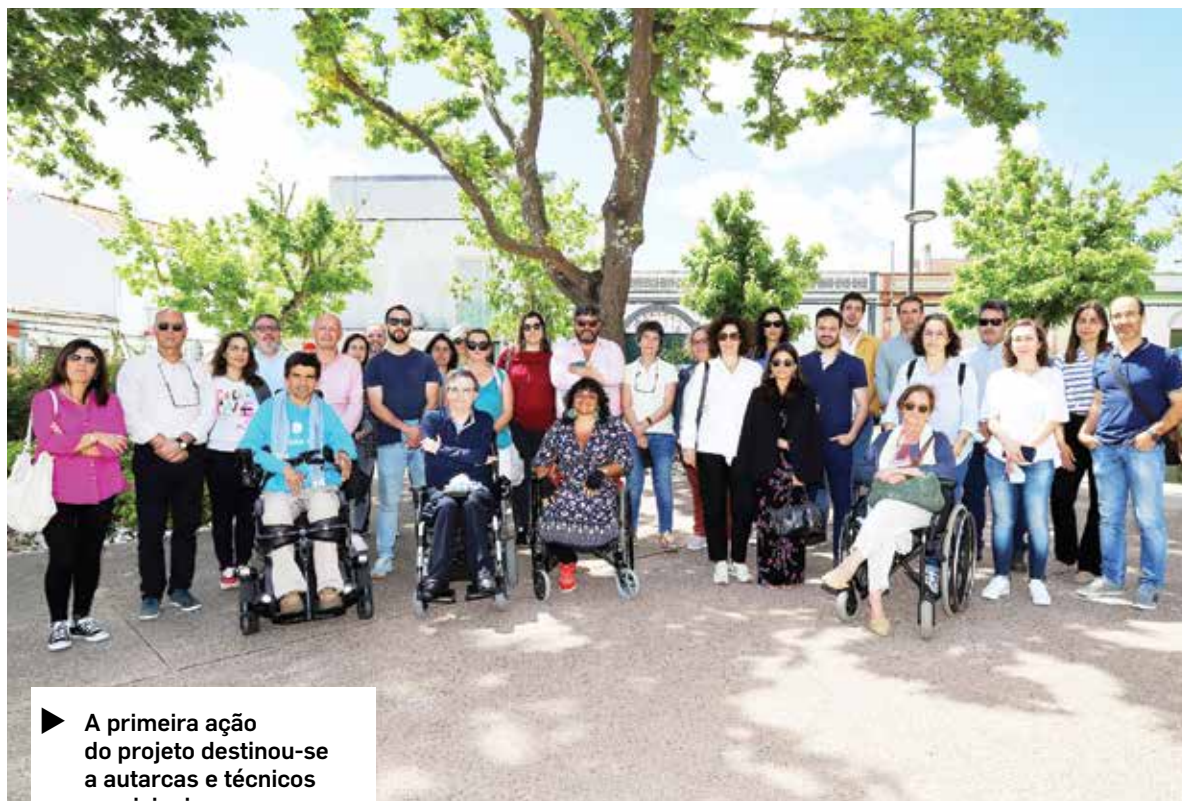
▶ A primeira ação do projeto destinou-se a autarcas e técnicos municipais

G rândola faz parte do conjunto de 15 municípios (Porto, Amarante, Maia, Gondomar, Guimarães, Leiria, Torres Vedras, Batalha, Tomar, Santarém, Rio Maior, Grândola, Ourique, Almodôvar, Castro Verde) que integram o Projeto. No dia 3 de junho realizou-se a primeira ação em Grândola, junto aos Paços do Concelho, com a presença do Executivo Municipal, do Presidente da Assembleia Municipal, dos Presidentes das Juntas de Fre-