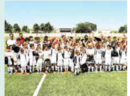
► DESPORTO | Grândola recebeu Clínica da Fundação Real Madrid