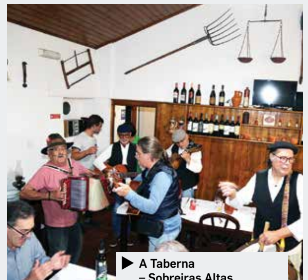
► A Taberna – Sobreiras Altas