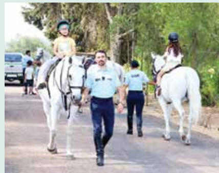
► EDUCAÇÃO | Um dia com a G.N.R. – Demonstração