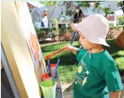
► CELEBRAÇÕES | Dia Mundial da Criança