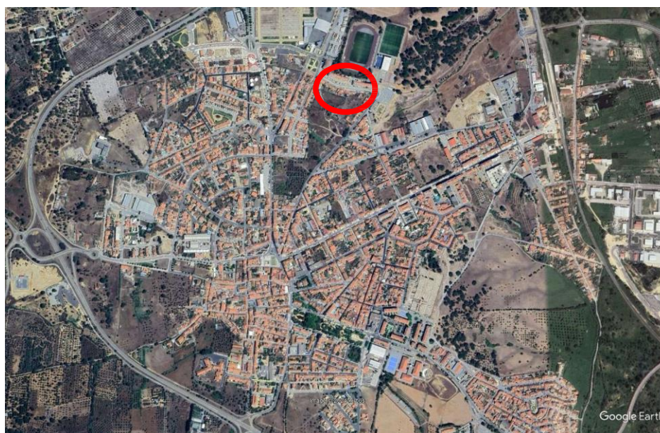
Localização: Rua 1.º de maio, 7570-145 – Grândola