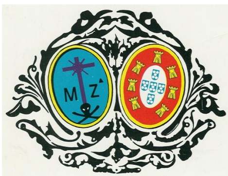
Fig. 2 – Actual brasão da Santa Casa da Misericórdia de Grândola

O brasão de armas da Santa Casa da Misericórdia de Grândola é composto por dois escudos ovais. O da esquerda apresenta duas túbias em aspa, encimadas por uma caveira, sendo esta encimada por uma cruz alta, a Cruz do Calvário, com raios nos cantos, e acompanhada da abreviatura de Misericórdia, tendo à direita a letra M e à esquerda as letras Z a . No escudo da direita, podem ver-se as Armas de Portugal.