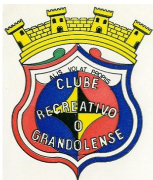
Fig. 4 - Brasão do Clube Recreativo o Grandolense

No brasão desta Associação, elaborado sem preocupações heráldicas, podem observar-se as cores das associações que lhe deram origem (vermelho, azul, branco, amarelo, preto e verde) e a expressão latina: ALIS VOLAT PROPRIIS (voa com as próprias asas).