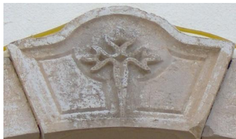
Fig. 1 – Hábito de Santiago sobre a porta principal da Igreja Matriz

A Ordem de Santiago é representada por uma Cruz, cujo braço superior é rematado por um coração de ponta voltada para cima. Contém, ainda, dois braços laterais florenciados e o inferior afilado em espada.