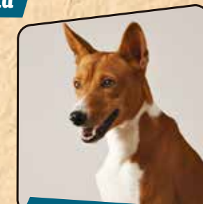
Concurso de Podengos Cães de Agarre e de Cães Cruzados de Agarre